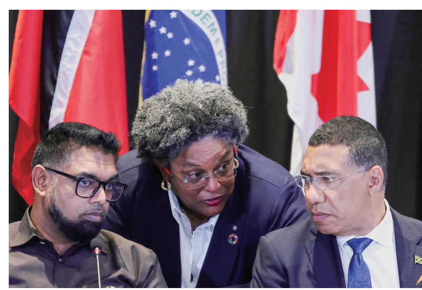
3月11日，加勒比共同体主席、圭亚那总统阿里(左)，巴巴多斯总理莫特利(中)与牙买加总理霍尔尼斯在牙买加首都金斯敦出席加勒比共同体与相关国家举行的紧急会议。

设施，要求亨利下台。海地政府3月7日宣布将太子港所在的西部省紧急状态延长至4月3日，并继续实施宵禁。8日，总统府附近爆发大规模枪战。