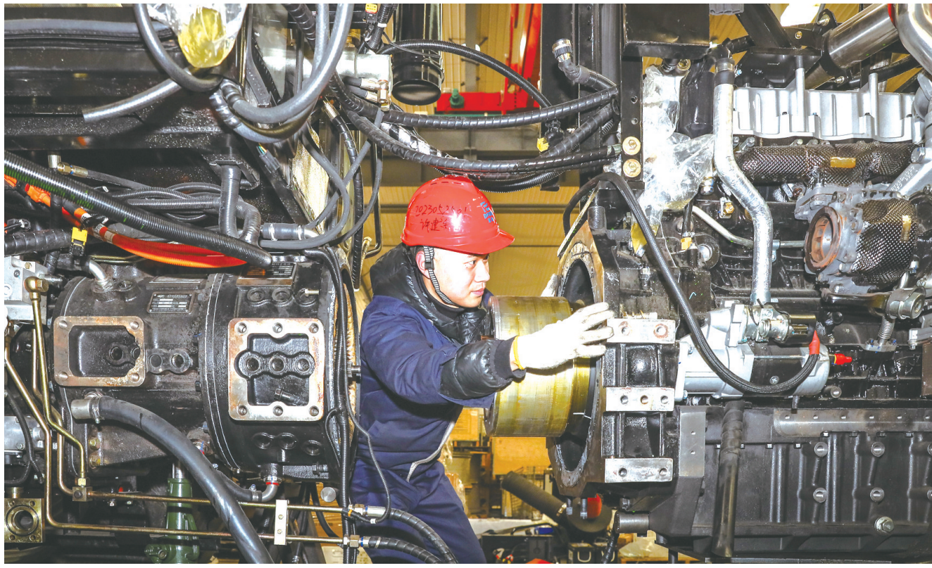
工程师正在对增程式拖拉机的零部件进行调试。

高端化、智能化、绿色化是发展新质生产力的三个关键词。去年以来，东风农机依托我市新能源产业链优势，研发