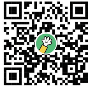
报名请扫描二维码