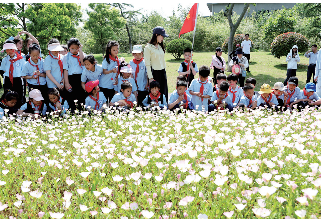
5月8日,华罗庚实验学校滨湖分校首届“滨湖少年行·环湖乐跑节”开跑,500余名师生及家长代表在鲜花丛中穿行、奔跑。