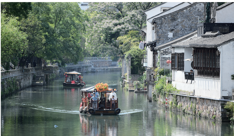
水乡 史康 摄