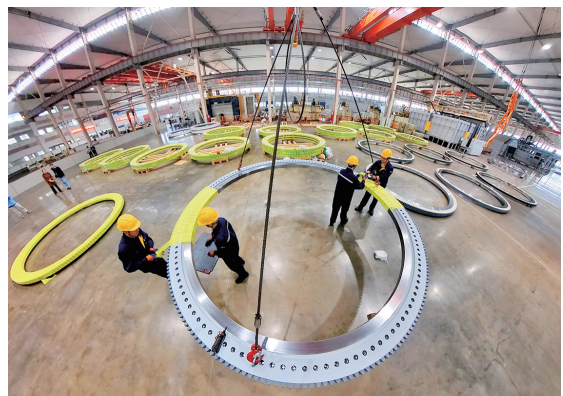
国内最大的轴承配件、重大装备部件制造产业基地。