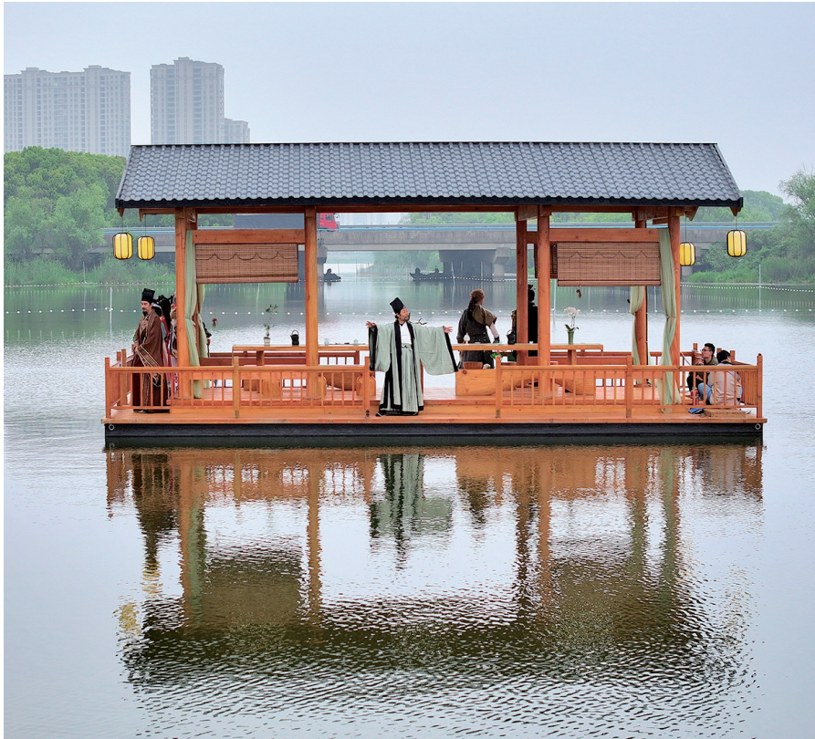
长田漾湿地景区的古装游船表演。