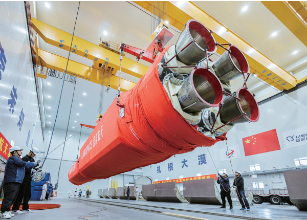
蓝箭航天,发动机部件吊装。