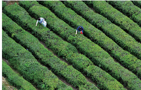
邱城遗址公园,游客体验采茶乐趣。