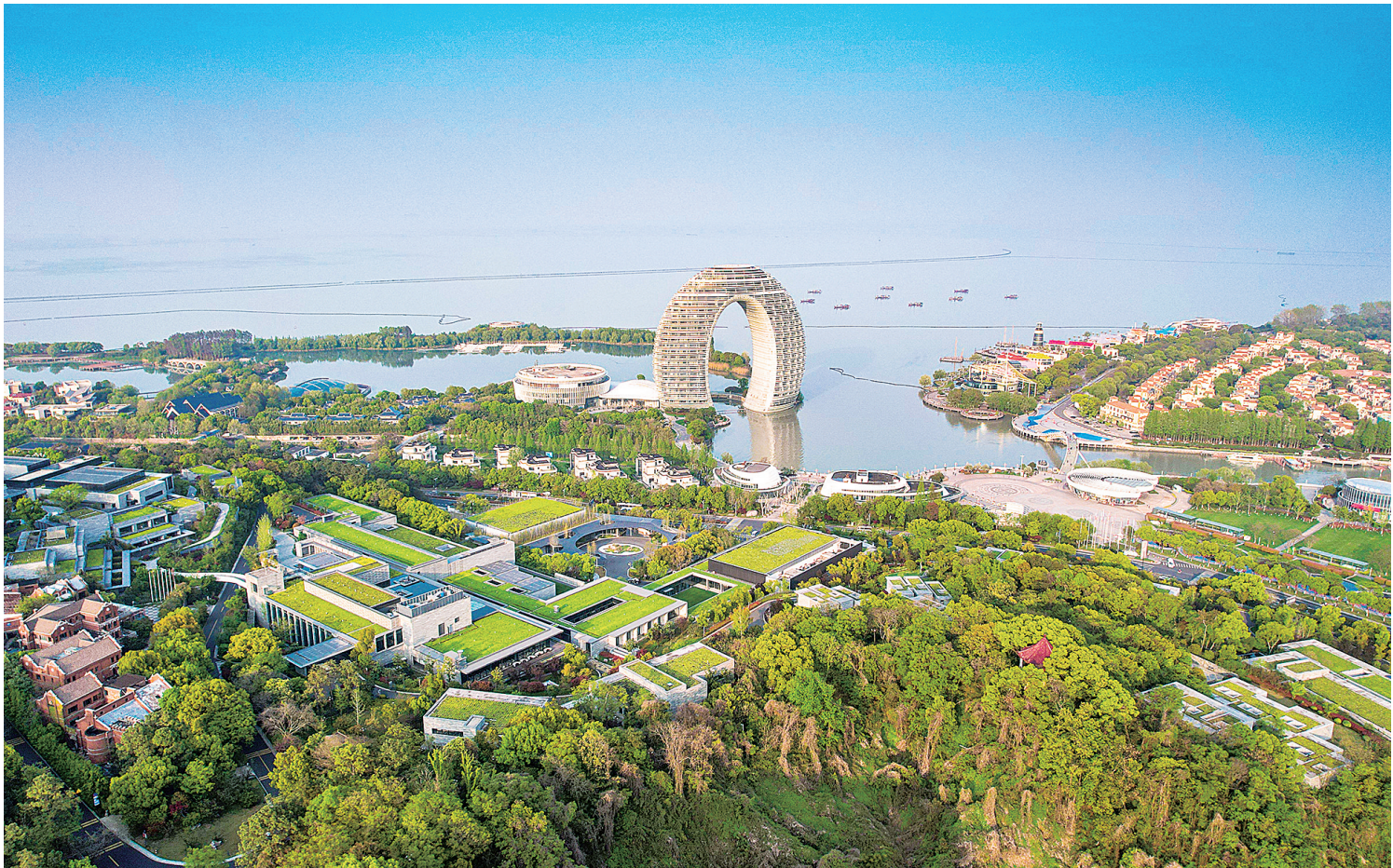
南太湖国家级旅游度假区。