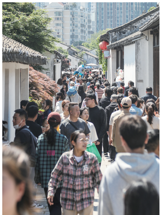
假日青果巷