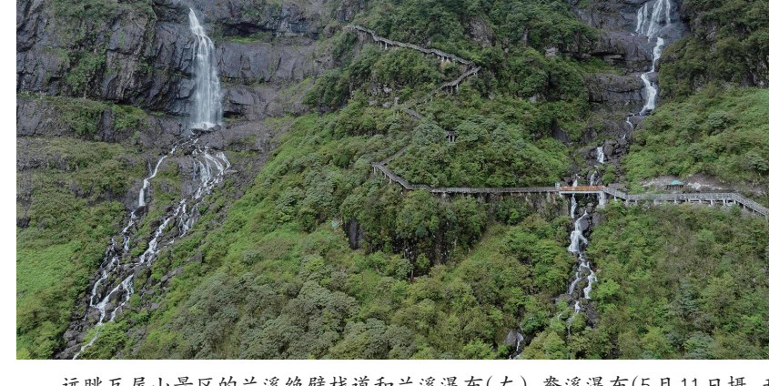
远眺瓦屋山景区的兰溪绝壁栈道和兰溪瀑布(左)、鸾溪瀑布(5月11日摄,无人相机照片)。

中国航天科技集团六院专家介绍,作为我国首款百公斤级车载液氢系统,“赛道1000”比上一代产品,在