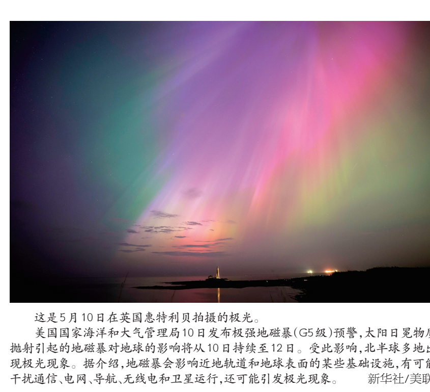
这是5月10日在英国惠特利拍摄的极光。

近日,位于四川省眉山市洪雅县境内的瓦屋山景区的兰溪绝壁栈道对游客开放,吸引不少游客前往体验。瓦屋山景区从2022年开始在玄武岩陡壁上修建“Z”字形栈道,打通景点兰溪瀑布与半山画廊,形成中高山区旅游环线。兰溪绝壁栈道和半山画廊栈道全长约4.5公里,海拔落差约310米,一个壁立千仞,一个万丈深渊,是“桌山”瓦屋山大断崖地质奇观的最佳游览路线。瓦屋山拥有近11平方公里的形似桌面的山顶平台,有着“云上瓦屋,最美桌山”的美誉。