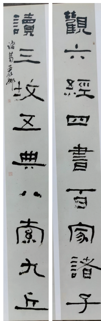
观六经四书百家诸子读三坟五典八索九丘 对联 诸葛丽娜