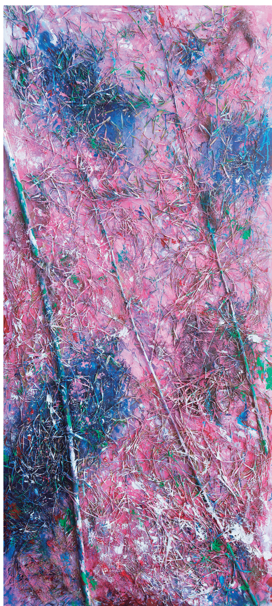
竹之影之二: 2021年 水墨纸本加综合材料 邵泳

邵泳是70后代表性水墨艺术家,作品创作强调重建与传统的关联,在全球化的语境中建构了自己的当代水墨艺术体系,体现了中国艺术家的智慧。他巧妙地自然景象与人文关怀相结合,利用丰富的创作语言拓展了水墨的表现领域。作品既承载了对宇宙、世界、人类的认知与觉醒,又表现了佛教中倡导的美学理论与思想,超越现实,诠释了一种没有“本体”的本体。