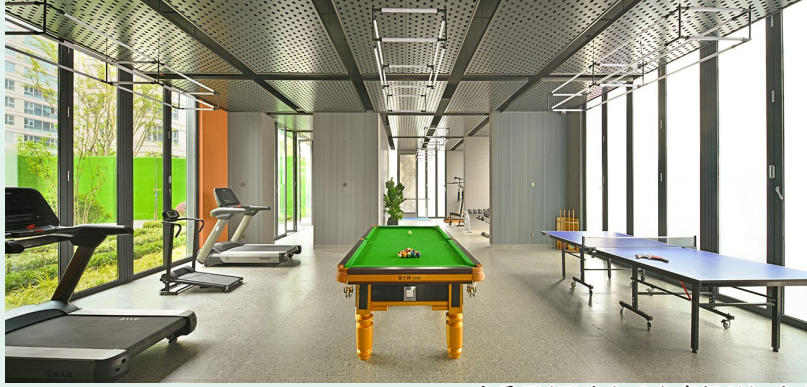
实景图 广告

儒辰·辰汐自一期交付以来,凭借先进的设计理念、硬核的产品主义,奠定了市场领先地位,交出了一份满意的答卷,也收获来自业界与业主的一致赞誉。然而交付只是销售的终点,却是服务的起点。儒辰·辰汐更有幸相逢时代掌潮者,并沉淀出与之共鸣的“辰汐Club”圈层精神,安放当代龙城净值人士的湖居生活。