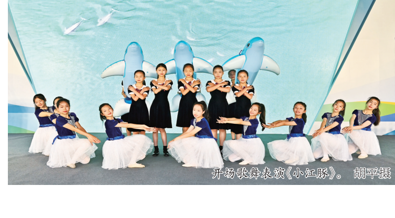
开场歌舞表演《小海豚》。

活动现场揭晓了2024年“低碳生活,美丽常州”生态文化作品征集活动获奖名单;发布了5条生态文化体验路线,让海内外游客更好地领略生态之美;发布了由常州市生态环境局精心制作的“六五”环境日主题曲MV。