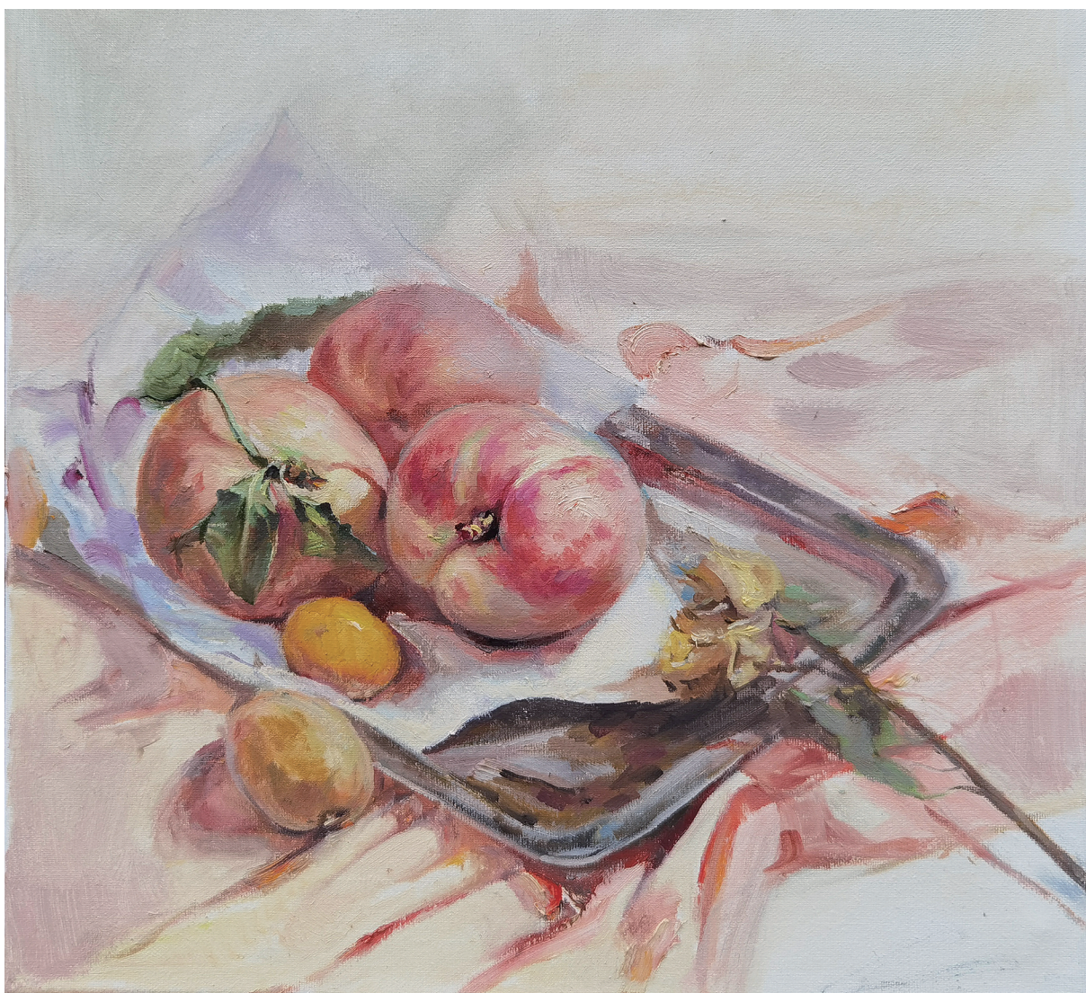
粉桃 (油画) 余恺

有幸第一时间研读《溧阳古今》书籍,感受颇深。该书叙说历史,犹如上下三千年的溧阳人、事、物和精、气、神的立体画卷,读来心旷神怡、美不胜收。