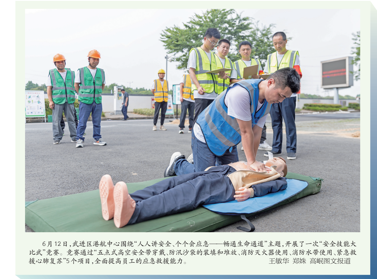
6月12日,武进区港航中心围绕“人人讲安全、个个会应急——畅通生命通道”主题,开展了一次“安全技能大比武”竞赛。竞赛通过“五点式高空安全带穿戴、防汛沙袋的装填和堆放、消防灭火器使用、消防水带使用、紧急救援心肺复苏”5个项目,全面提高员工的应急救援能力。

自今年3月市应急管理局机关第一党支部与红梅村党总支结对共建以来,双方便积极开展各类安全宣传活动,此次“进社区”活动便是其中的一环。活动现场,安全小课堂、有奖问答等环节深受村民喜爱,丰富了大家的精神文化生活,也有效提升了大家的应急自救能力。