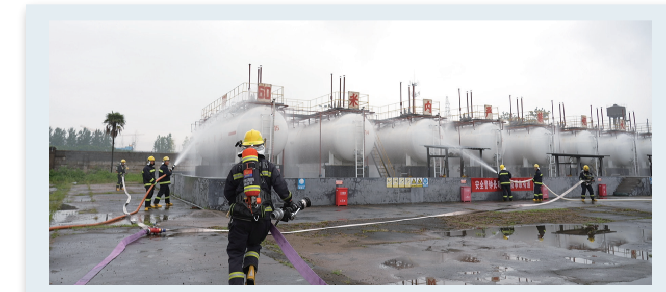
6月25日上午,市住建部门举行储罐泄漏事故应急预案演练。演练模拟常燃液化气有限公司储罐老化导致液化石油气大量泄漏,应急预案立即启动,现场检测、人员疏散、险情救援同时展开。消防员出枪冷却储罐,稀释泄漏的液化气,抢险人员冲入罐区,关闭阀门、封堵泄漏源,并进行抢修作业,成功消除了事故险情。此次演练有效锻炼了住建等相关部门的应急救援和协同作战能力。

本报讯(郝燕波 吴叶飞 高丽萍)近日,溧阳市农产品电商行业妇女第一次代表大会暨“溧品荟”巾帼助农共富集市宣传推介活动在曹山农产品电商服务基地举行。溧阳各镇(区、街道)妇联主席及溧阳市女企业家协会代表共同担任农产品巾帼推介官,对溧阳50多种特色农产品进行公益推介。近年来,溧阳市妇联积极探索新经济、新业态下妇女创业就业新模式,带领广大女性抢占云端经济高地,全链条引领服务女性在电商领域创新创业。