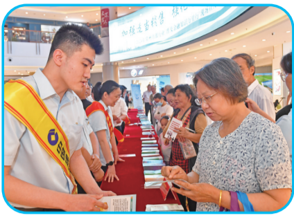
□本报记者 徐杨 通讯员 建莹