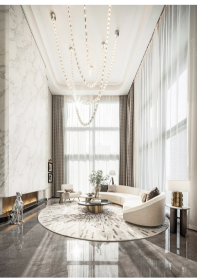
立面曲线在运河之滨 竖起宜居新标志

老运河之滨的万科臻湾汇,不仅置身常州主城区老城厢核心点位、浸润于常州城市的千年历史文化,更与建设中的大观楼、止园景区,与三堡街运河5号历史文化街区形成品字型分布,区域价值日益凸显。