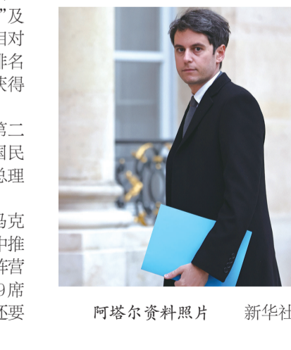
阿塔尔资料照片