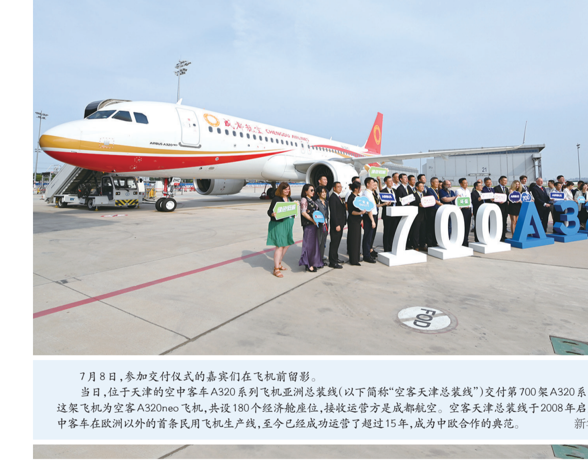
7月8日，参加交付仪式的嘉宾们在飞机前留影。当日，位于天津的空客A320系列飞机亚洲总装线（以下简称“空客天津总装线”）交付第700架A320系列飞机。这架飞机为空客A320neo飞机，共设180个经济舱座位，接收运营方是成都航空。空客天津总装线于2008年启用，是空客在欧洲以外的首条民用飞机生产线，至今已经成功运营了超过15年，成为中欧合作的典范。

英国广播公司称，古赛因之死可能对哈马斯军事行动影响不大，但他在哈马斯所组建政府的领导层中地位关键。