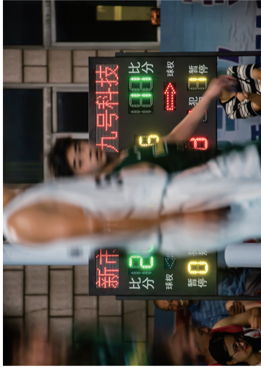
首场由企业队和村队对决