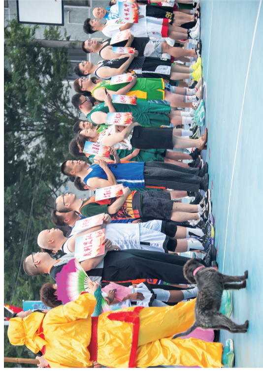
12支代表队报名参赛