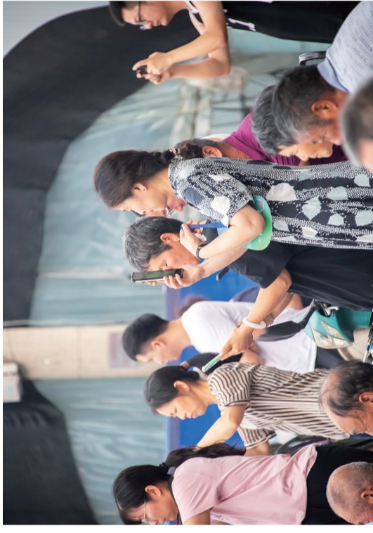
村民纷纷拿起手机拍下打球镜头

据了解,今年参赛的球队除了新市村、五圩村等村级球队,还有江苏省奔牛高级中学、奔牛实验小学等校队和九号科技有限公司等企业球队,奔牛镇综合行政执法局也组队参加了比赛。 根据市文明办部署开展的“2024年常州市新时代文明实践基层联赛开展系列活动”,作为奔牛镇新时代文明实践联赛开展系列活动之一,本届“村BA”将持续到7月底。此外,奔牛镇新时代文明实践所还将举行丰富多彩的活动,让百姓身边的文明实践服务长流水、不断线,精神文化生活不断提升。