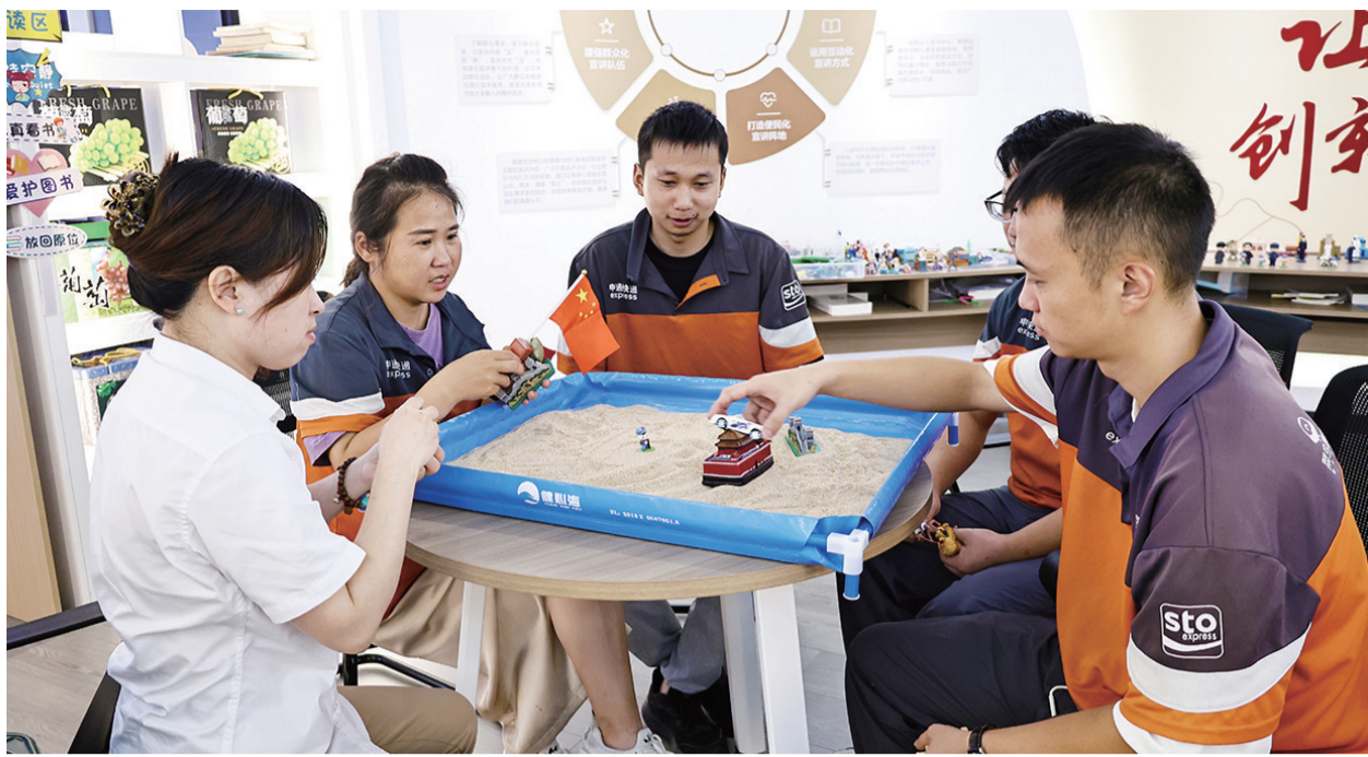
妙趣横生的心理课