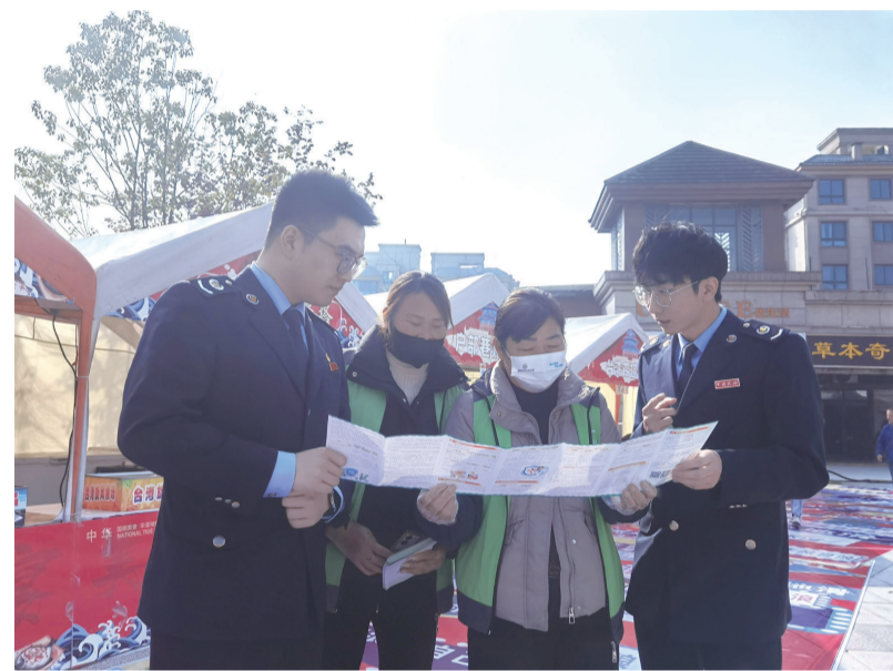
近日,溧阳市税务局天目湖税务分局在2024年冰糖葫芦文化节开幕之际,组织青年税宣队进行专项税费宣传,帮助商户了解政策,规范营业,健康发展。王琦图文报道

目前,溧阳在国有产权交易领域已实现交易保证金、履约保证金、租金三大数字人民币应用场景,全方位覆盖了交易的关键环节,让国有产权各方交易主体切实感受到数字化带来的便利,也彰显了分中心在公共资源交易领域积极创新,不断优化营商环境的决心与行动力。