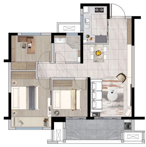
建筑面积约98平方米户型图(图片由开发商提供)广告

全生命周期户型,定义家庭首置标准,丰臣南郡二期深研每一寸空间肌理,建面约98平方米全生命周期首置户型,全面考虑两小口、三代同堂、二胎时代等不同阶段,满足家庭结构各阶段居住需求,让生活充满无限可能。