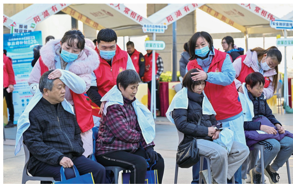
高 ——每月固定开展“阳湖有好市·好市连连传”活动,把公益宣传、政策咨询、便民生活等志愿服务,以及质优价廉的地方老字号商品送到“家门口”,打造新时代文明实践“中央厨房”重要载体。