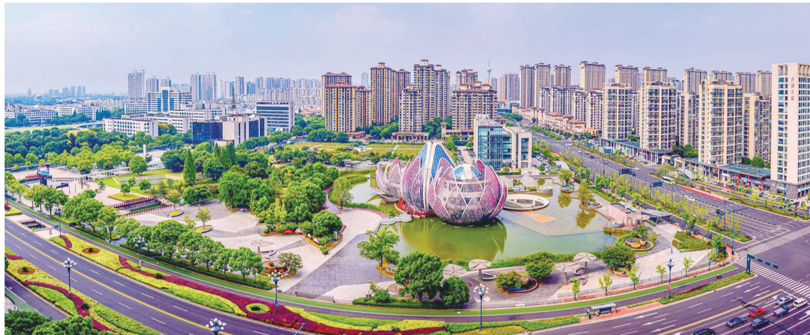
强 ——武进区连续11年获评全国综合实力百强区第三,同步获得2024年度全国投资潜力百强区第一。