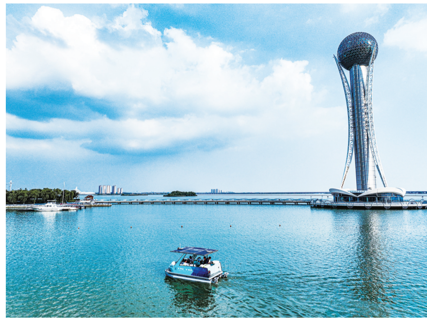
美 ——西太湖畔,“氢湾”企业飞凡游艇的氢能游艇成功下水试航,“低碳”绿撞上“两湖”蓝,“生态创新区,最美湖湾城”的画卷徐徐铺开。