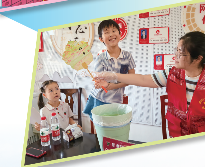
本版撰稿:孙景辉 杨嘉韵 董华岗 王淑君