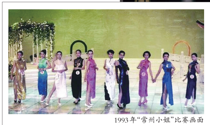
1993年“常州小姐”比赛画面