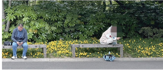
姑娘，坐有坐相，请向你旁边人学习哟。