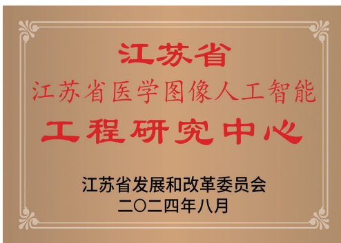
江苏省发展和改革委员会 二〇二四年八月

主任委员、江苏省医师协会放射医师分会副会长、中华医学会放射学分会腹部专委会委员、常州市医师协会放射医师分会会长等;在2013年、2017年、2021年承担3项国家自然科学基金项目资助的基础上,于2024年再次获批1项国家自然科学基金面上项目和1项江苏省自然科学基金面上项目资助;担任《中华放射学杂志》《临床放射学杂志》和《中国医学影像学杂志》等杂志编委;获国家专利授权6项;被授予“江苏省有突出贡献中青年专家”“常州市五一劳动奖章”“常州市十佳科技工作者”等荣誉称号。