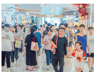
中秋夜,市民们走出家门购物逛街。