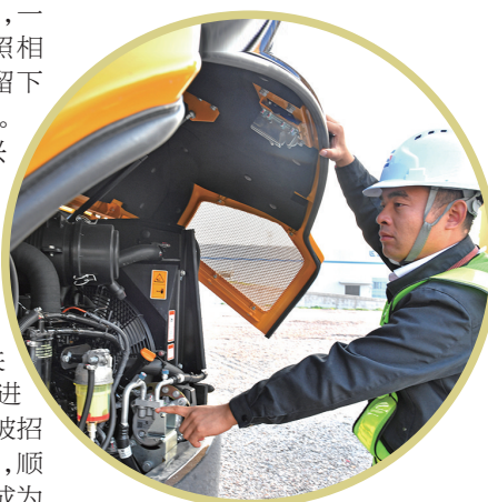
每次表演前许欢都要认真检查挖机状态

之王,装载机、推土机、装料机的活,它都能干,几乎在各类场合都可以广泛使用,越操作他便越喜欢。直到2019年他被调到管理岗位,8年间他天天和挖机在一起。