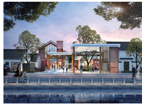
航海仪器厂改造后的大门效果图

历史上，运河三堡街段曾是漕粮转运枢纽，很有名的西仓便建在这里。新中国成立后，这里成为老厂的聚集地。如今，部分老厂区变身工业遗存，昔日的旧厂房已经或者正在变成文创聚集地和文旅新地标。