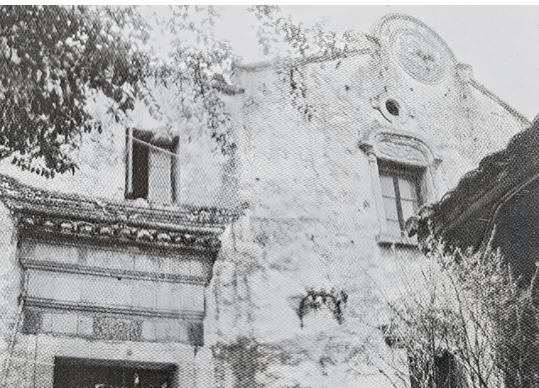
包立本拍摄的乌衣浜老宅

这里是《档案柜》，一个深度记录常州往事的版面。 如果您记忆中有一段珍贵的往事，关于这座城，关于一些人，请找我们聊聊。拂去历史尘埃，留住岁月痕迹。 线索及投稿邮箱：272173743@QQ.com，一经采用，即付稿酬。