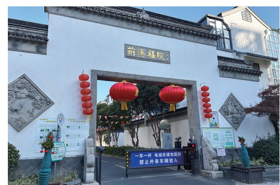
如今，乌衣浜建起了现代化居民区。

锦清的纺织厂，当时还有恒丰盛一厂、恒丰盛二厂、久成、达源、顾竟昌等多家染织厂开设其中，机器轰鸣，员工往来，一派繁荣景象。