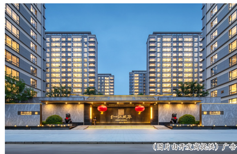
(图片由开发商提供)广告

看遍了城市喧嚣的人,总是更热衷于追求精神的富足,在自然风景、回归本真等多维诉求中寻找更高的人生追求。