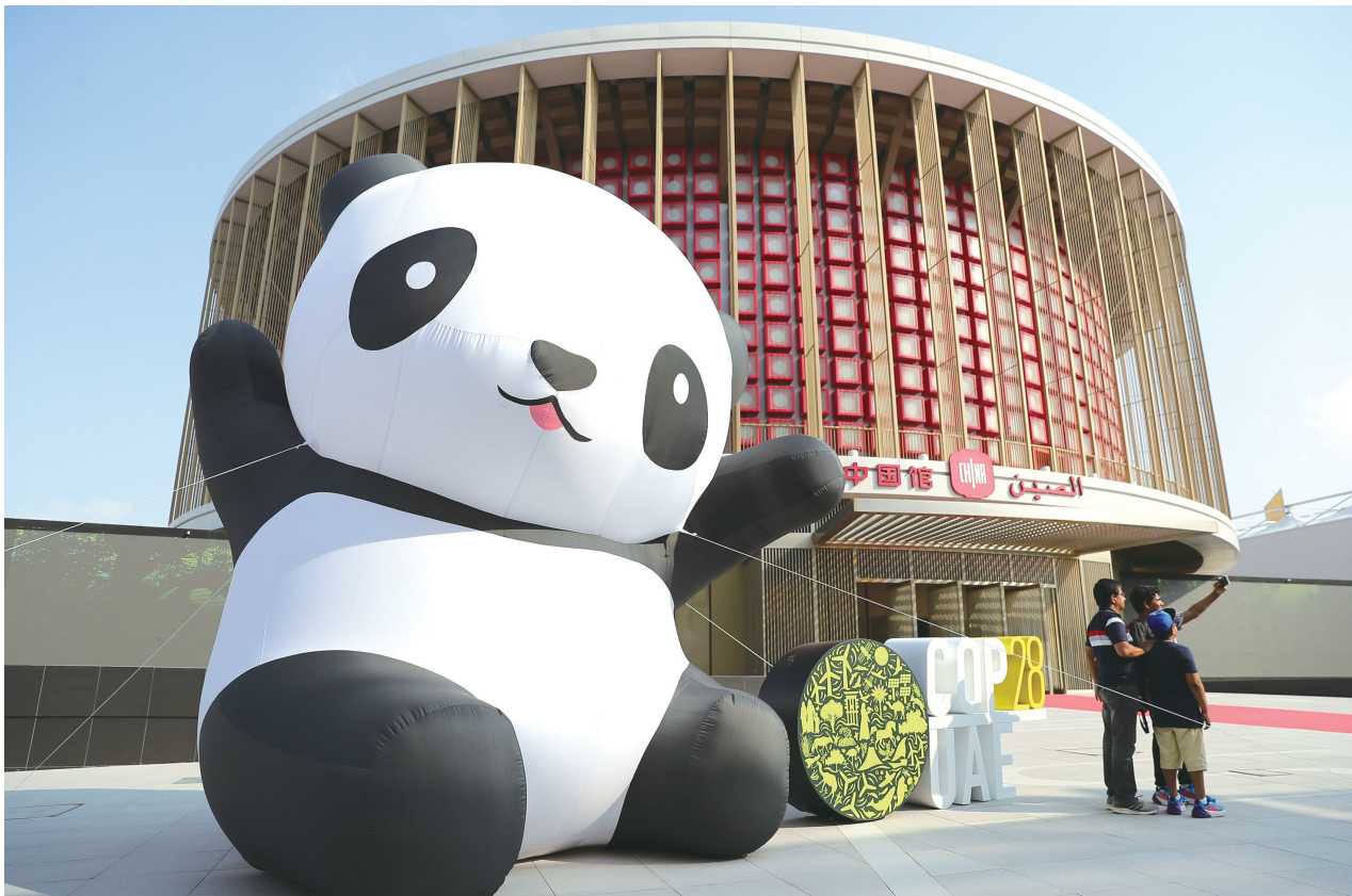
12月3日,人们在联合国气候变化迪拜大会“绿区”的中国馆前拍照。

“我们是受气候变化影响最大的群体之一,(对未来的)信心不会来自发达国家的承诺,真的不会,因为等待他们兑现承诺似乎要‘永远’那么久,”国际原住民气候变化论坛联合主席杜·奥马鲁·易卜拉欣在阿联酋迪拜参加《联合国气候变化框架公约》(以下简称《公约》)第二十八次缔约方大会(COP28)时对记者说。