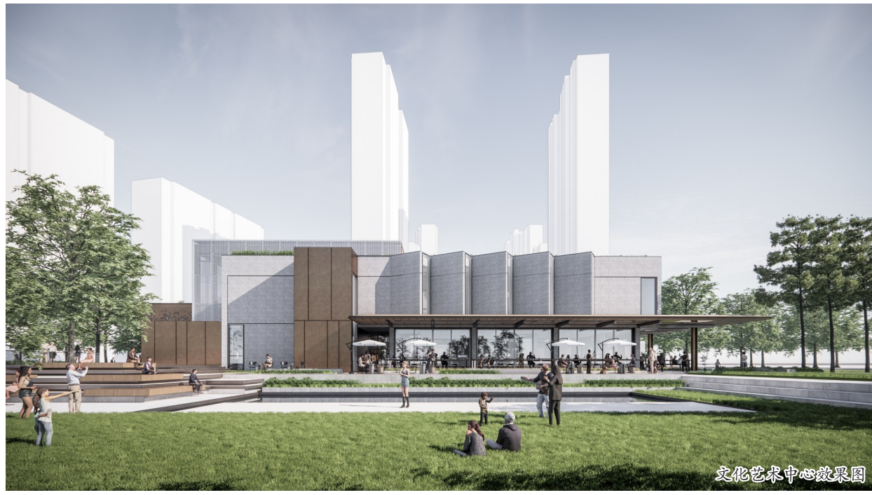
文化艺术中心效果图

一座城市的历史文化与它的艺术气质密切相关,杭州不仅有西湖还有极具艺术气质的西泠印社、中国美术学院;苏州的拙政园旁还有建筑经典的苏州博物馆;常州的艺术气质当然与红梅阁、青果巷密不可分……于是,ICC白云新城把原常大研究院设计更新成了一座拥有专业等级音乐厅的文化艺术中心,在梧桐河打造一个艺术剧场公园,甚至在杨柳岸边打造一座“柳叶桥”……ICC白云新城无论是城市风貌设计、公共空间营造、城市功能配置,无不透露出一种别样的文艺气质,既现代又历史;既开放又充满内涵;既是物理条件的配置又是市民文化艺术活动的平台,ICC白云新城将是一座别样的文艺之城。