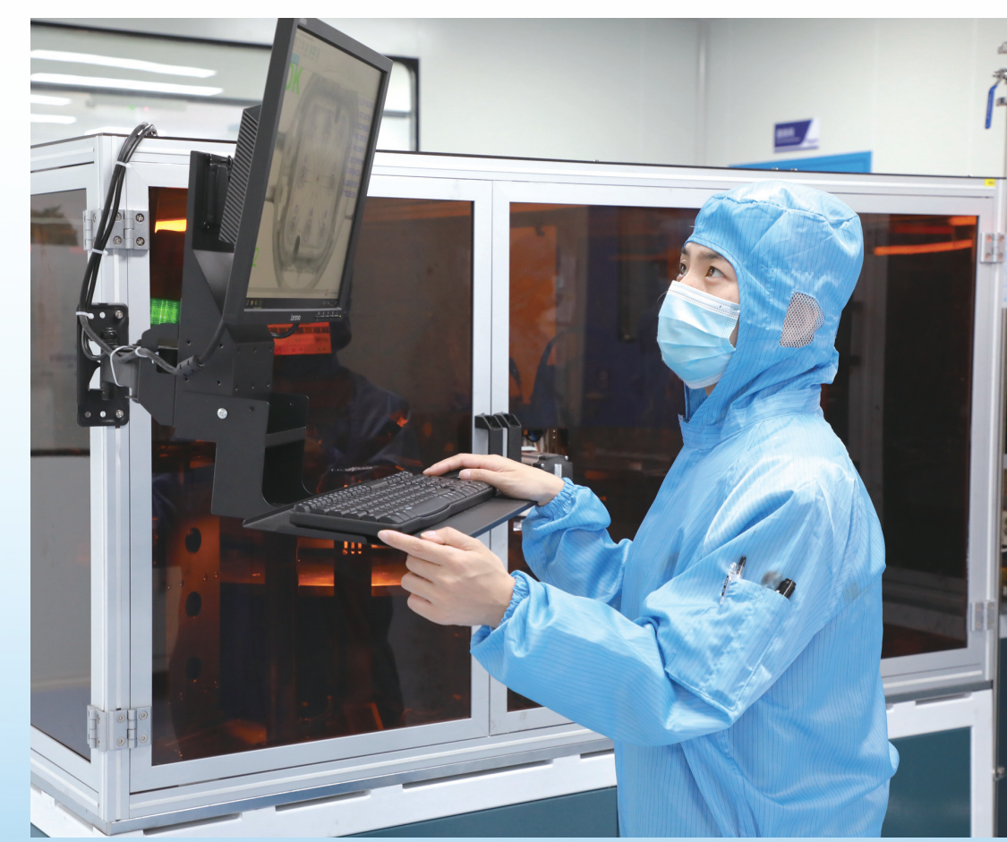
实验人员在常州天地人和生物科技有限公司实验室进行填料应用检测