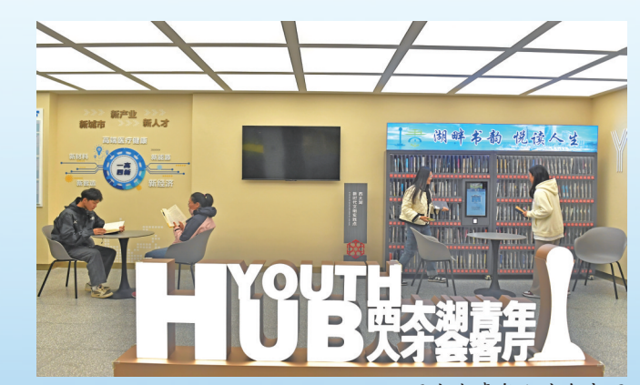
西太湖青年人才会客厅