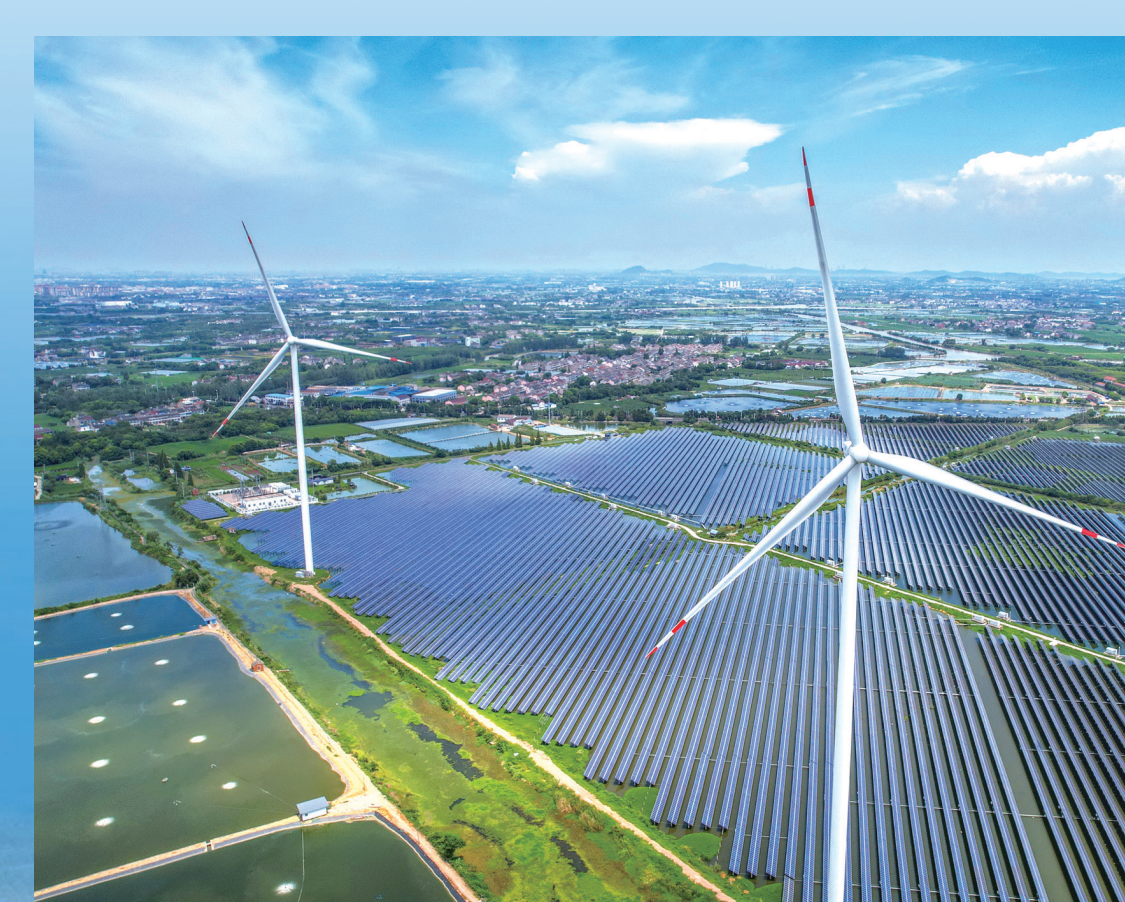
苏南地区最大的单体风光一体项目——九洲裕光大型风光互补发电厂