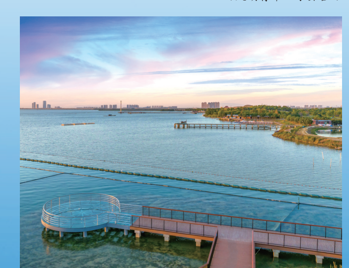
退田还湖工程将湖湾打造成绝佳光影欣赏地