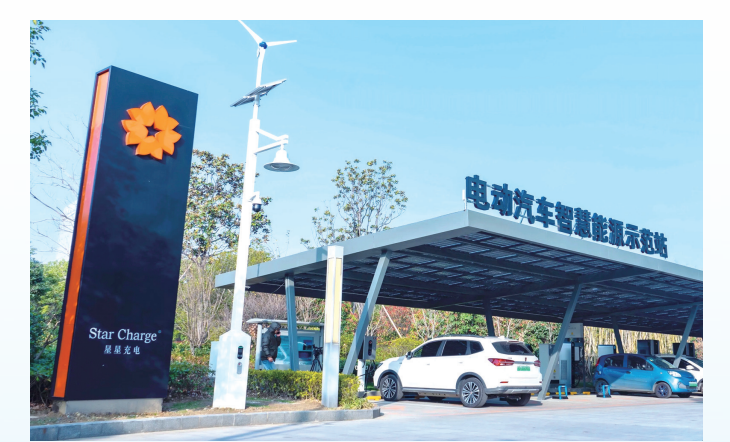
星星充电电动汽车智慧能源示范站