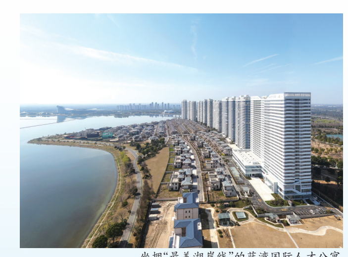
坐拥“最美湖岸线”的蓝湾国际人才公寓

今年1—10月,武进区新能源企业完成产值 1636.6亿元 ,同比增长 27.23% ,其中新能源汽车及核心零部件企业完成产值 1323.2亿元 ,同比增长 64.35% 。 1—11月,理想汽车累计交付新车 325677辆 ,提前达成全年30万辆销量目标。 全区光伏发电新增备案容量 26.59万千瓦 ,发电量累计 1.38亿千瓦时 ,超额完成全年目标。