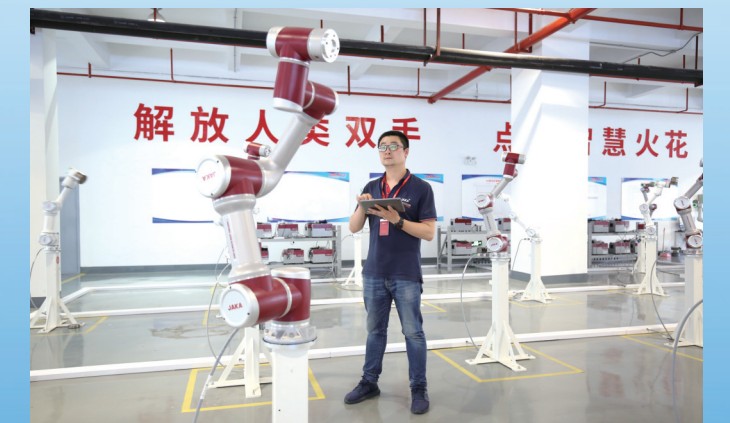
节卡机器人科技有限公司最大的生产制造基地