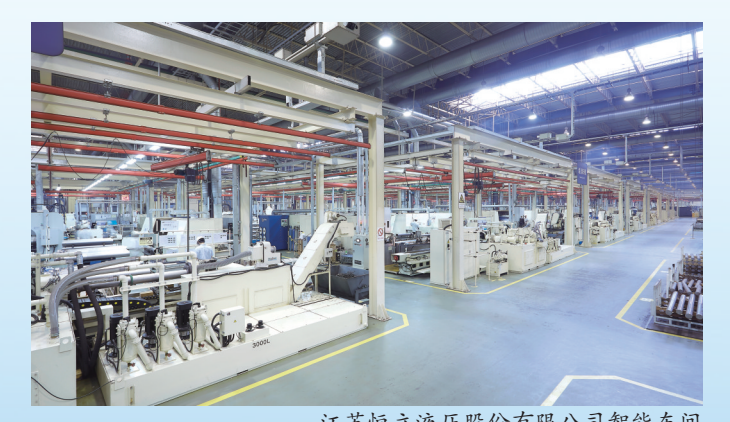
江苏恒立液压股份有限公司智能车间