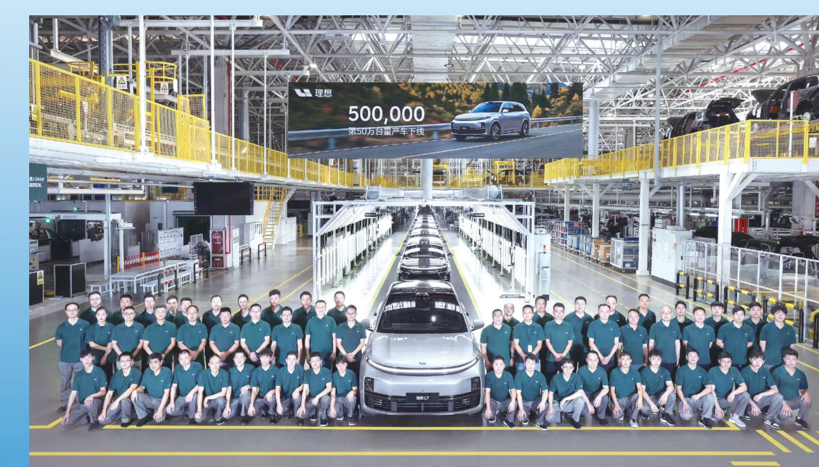
理想汽车第50万台量产车下线

渐次铺展。 有风景的地方就有科技创新。聚焦优势产业,武进全力引进旗舰型、龙头型、科技型重大项目,推动未来产业布局落子、拔节成长。核心区集聚生态生创、伯仪生物、赛恩贝等一批重点合成生物产业化项目,新赛道上全力竞速。常州医药国际创新中心一期、常州氢湾国际创新社区一期、长三角青年创新创业港等一批平台载体接续打造,为加快培育新质生产力夯基筑台。 创新策源地也是人才蓄水池。以人为核,医疗、教育、文化、体育等资源不断向“两湖”延伸,增强服务功能的同时,为湖湾注入新活力。核心区还积极引入国际化程度高、深受年轻群体喜爱的体育项目,历时5个月的水上运动季,让全国观众近距离领略蓝绿交织、水清鱼跃的湖湾风光。坐拥“最美湖岸线”的蓝湾国际人才公寓、总规划面积300亩的国际露营岛项目、满足人才多样需求的“星湖荟”各店……武进精细打磨每一处地标、每一个亮