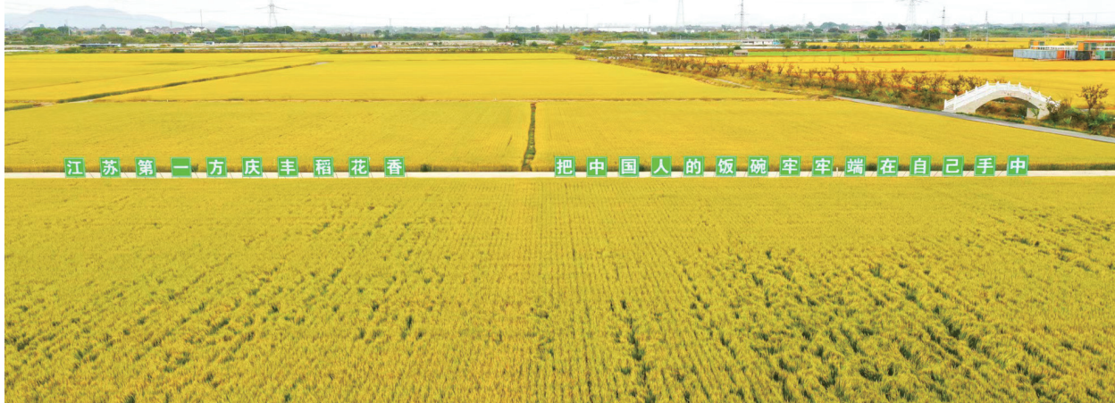
江苏第一方庆丰收花香 把中国人的饭碗牢牢端在自己手中

裕党建引领“123”工作法和支部建在“联”上,扎实推进“供销党员代表”派驻联系行动,培育供销党建品牌,开展“供销大讲堂”理论宣讲走基层活动,着力打造常州供销特色党建品牌。据了解,“供销大讲堂”通过“集中典型宣讲+分散式宣讲”方式,走进乡镇农合联、特色产业农合联、农村综合服务站、供销基层组织及美丽乡村,创新开展“你一起讲、您讲我听、您听我讲、边看边讲、田间课堂、围桌共话、音乐课堂”的乡村振兴“七讲”活动,用老百姓喜闻乐见的形式把党的创新理论宣传好,以实际行动打造助力乡村振兴、促进共同富裕的“供销样板”。