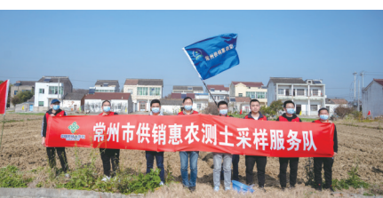
本版撰稿:常供销 秋冰

今年12月29日,全市迎来常州市供销合作社第八次代表大会召开。回首五年,常州市供销合作社在习近平总书记擘画的“强富美高”新江苏建设宏伟蓝图中,砥砺前行,不辱使命,积极践行新发展理念,谋划推进高质量发展,倾情倾力服务乡村振兴,全心全意促进共同富裕,在奋力推进“532”发展战略、阔步迈入中国式现代化新征程中贡献供销力量。