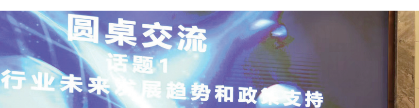
圆桌交流 话题1 行业未来发展趋势和政策支持

本报讯(龚励 潘小瑜)锂电池运输、智慧物流、园区管理……经济社会发展离不开生产性服务业的支撑。“顺丰新征程,创新2023”常州新能源行业供应链论坛日前在我市举行,全市近百家新能源及物流企业代表共聚一堂,就新能源行业供应链物流的转型升级展开交流。