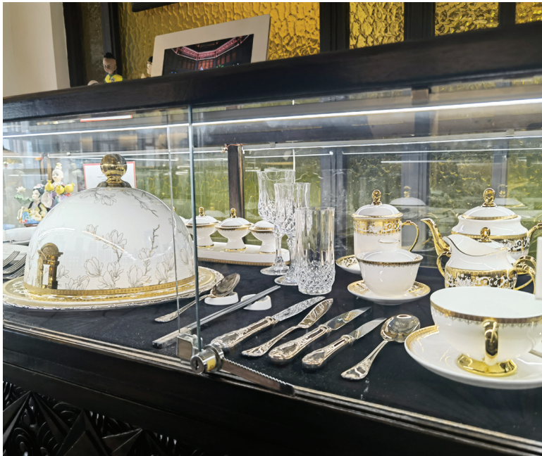
第二届进博会欢迎宴会上呈现的国宴餐具

2019年11月4日,国家主席习近平和夫人彭丽媛在和平饭店举行宴会,欢迎出席第二届中国国际进口博览会的各国贵宾。