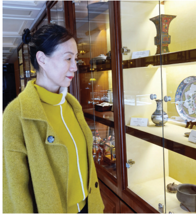
作者在和平博物馆

和平博物馆是国内第一家以饭店形式存在的博物馆,馆内陈列着华懋饭店开业时带logo的餐具、银质房间钥匙、铝制唱片、豪华器皿、拉利克灯饰,还有各种银制餐具、水晶摆件等一批“古董级”用品,曾经在此下榻的名人及政要的照片及名人留言等,极具年代感。在这个空间里,华懋饭店(1929—1952)、和平饭店(1956—2007)以及精心修缮后重新开张的酒店三个阶段的样貌一览无余。