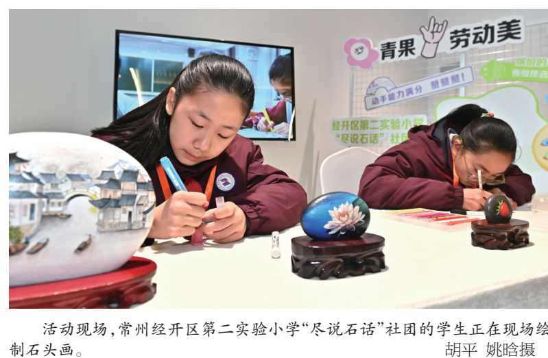
活动现场，常州经开区第二实验小学“尽说石话”社团的学生正在现场绘制石头画。

人的精神文化生活。启动仪式分为“冬·常悦”“冬·常安”“冬·常趣”三个篇章。武进区李公朴小学、常州市青少年活动中心通过精彩的京剧选段联唱，彰显了我省“戏曲进校园”活动的喜人成效。新北区实验中学的学生们带来的快乐球操，引领全省未成年人在寒假生活中加强锻炼、增强体质。第四届“童真里的色彩”儿童画创作大赛举行了颁奖仪式，孩子们的画作充分展示了新时代少年儿童朝气蓬勃、奋发向上的精神风貌。启动仪式上，活动还倡导全省未成年人充分利用寒假时间，做力所能及的家务劳动，培养生活技能；努力学习急救知识，守护好自己和身边人的安全健康；注重自身心理健康，有需要时及时向“96111”未成年人24小时公益服务热线求助；积极参与“我们爱科学”活动，从小树立“科技强国”远大志向。