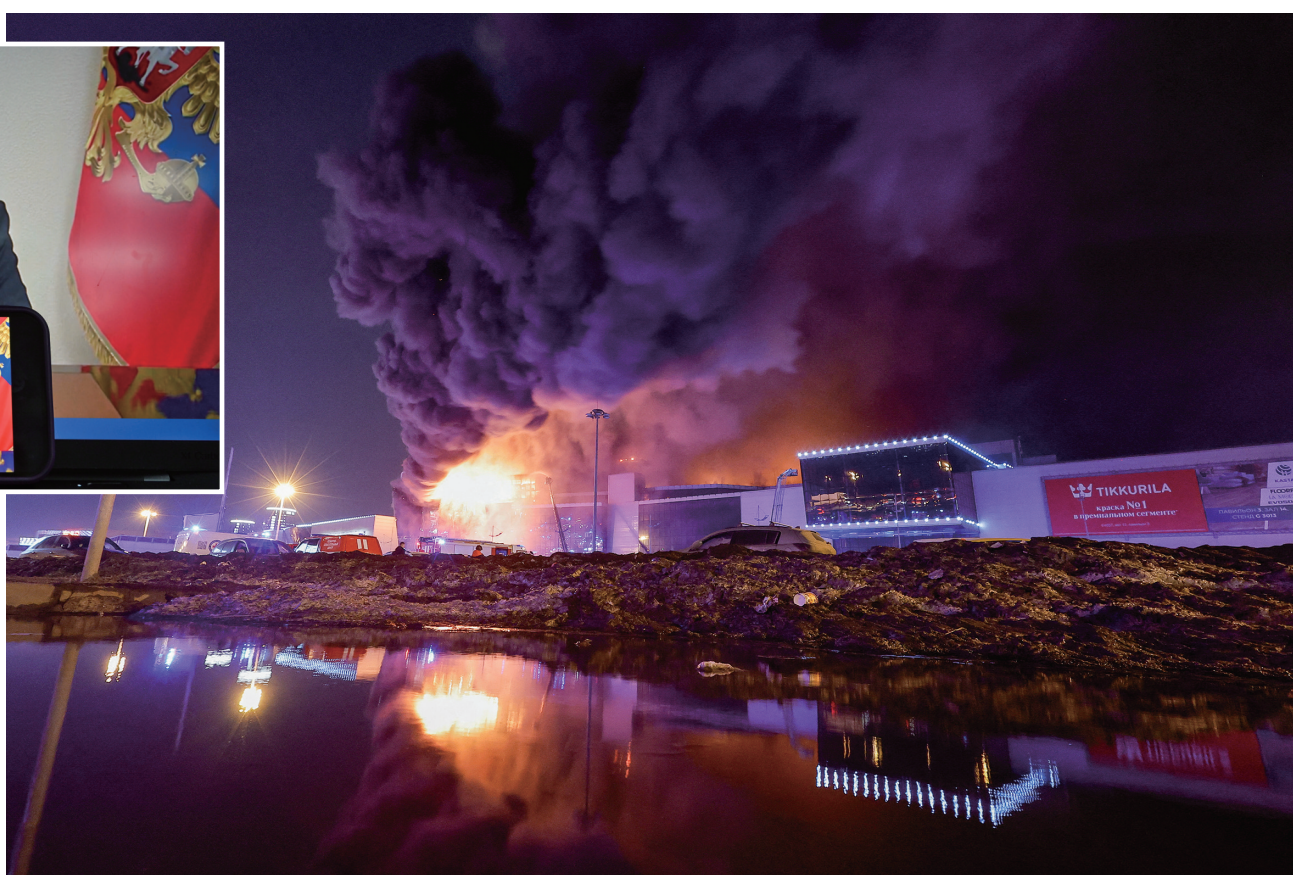
这是3月22日在俄罗斯莫斯科近郊克拉斯诺戈尔斯克市拍摄的火光中的“克罗库斯城”音乐厅。

俄罗斯首都莫斯科近郊克拉斯诺戈尔斯克市一家音乐厅22日发生枪击事件,导致超过143人死亡、100多人受伤。俄罗斯政府把这起事件定性为恐怖袭击。