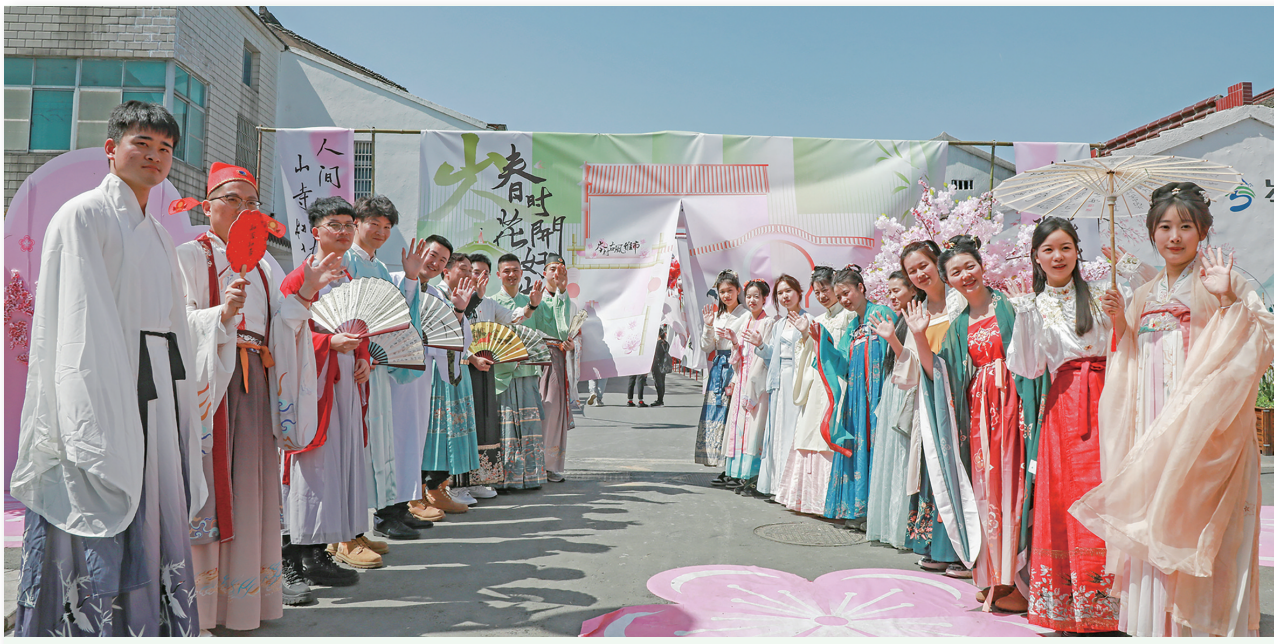
3月29日—31日,武进区洛阳镇举办“又见桃花开”第二届品味洛阳文化系列活动,汉服秀、古风集市、游园赏花、品味书香,一幅农业强、农村美、农民富的诗意田园图景正在当地徐徐展开。

本报讯(记者 周洁)阳春三月,生机盎然。周末,不少市民选择就近出游赏花。记者在市内各公园、景区和乡村旅游点看到,文旅景点及市民游客皆以实际行动践行文明旅游理念。 赏花者也是护花人。在花谷奇缘景区,数以万计的郁金香已绽放,将景区装扮得美不胜收。春花绽放,迎来学生春游团队与赏花散客客流高峰。“同学们可以用自己的眼睛记录下这美丽的景色。观景时千万要注意,不要伤害花草,后来的小朋友才可以继续看到这美好的风景。”记者看到,在带队老师的引导下,某小学春游的学生们都做到了文明出游,不仅自己不攀折花朵,遇到不自觉踏入草坪的游客还会主动劝导。 植花者也是宣传员。在东方盐湖城,最新项目“山海花境”以真花与假花缔造了多处奇幻繁花美景,吸引了大批游客前来打卡。据悉,景区专门成立了文明旅游志愿服务队,为游客宣讲文明旅游公约、发放文明旅游宣传折页,引导游客文明出游,做到不采不折、不踩不踏、不随地吐痰、不乱扔垃圾。