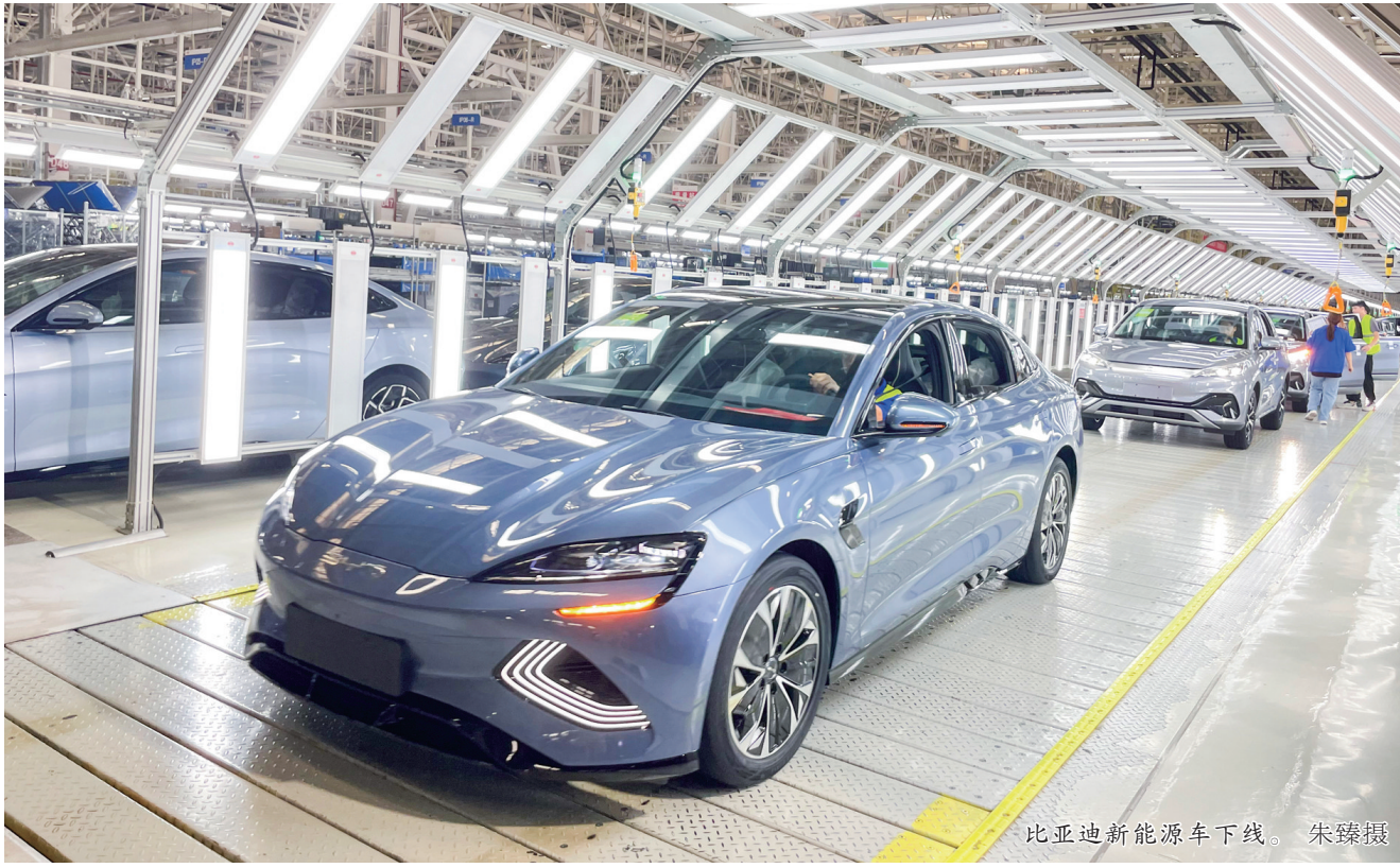
比亚迪新能源车下线。

以传统纺织服装企业常州华利达服装集团为例，企业借助工业互联网标识，赋予每块布料、每件衣服甚至衣架一个“身份证”；其自主研发的一系列自动化设备，同样被赋予数字传输功能，人、机、料等相关信息实时录入，集成应用。这些智能化改造升级，让企业从“大规模制造”走向“个性化定制”，在完成小批量、快时尚、加工复杂、附加值高的订单中取得优势，打出了产业增长新动能。