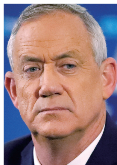
战时内阁成员甘茨

以色列国防部长加兰特、战时内阁成员甘茨等高官近来接连对总理内塔尼亚胡的决定公开提出反对意见，甘茨甚至以退出战时内阁相威胁。分析人士认为，这些举动让以色列高层早已存在的内部分歧公开化，背后是以色列在加沙冲突中陷入困境引发的国内民意变化。如果代表中左翼的甘茨退出战时内阁，以政府在巴勒斯坦问题上的政策或将更加“向右”。