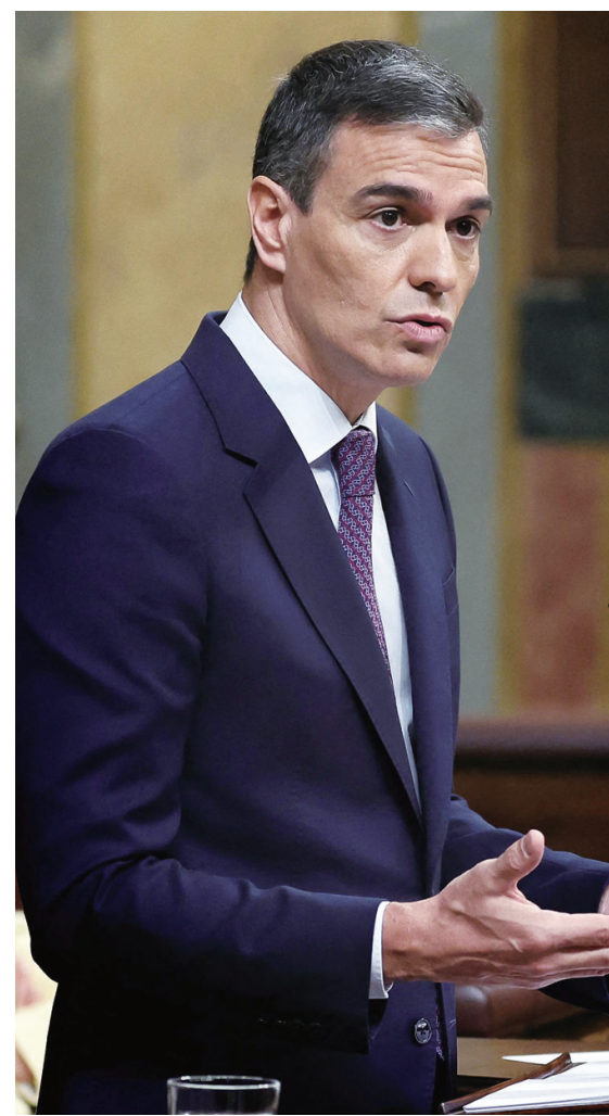
挪威首相斯特勒(左)、爱尔兰总理西蒙·哈里斯(中)、西班牙首相佩德罗·桑切斯22日分别宣布承认巴勒斯坦国。