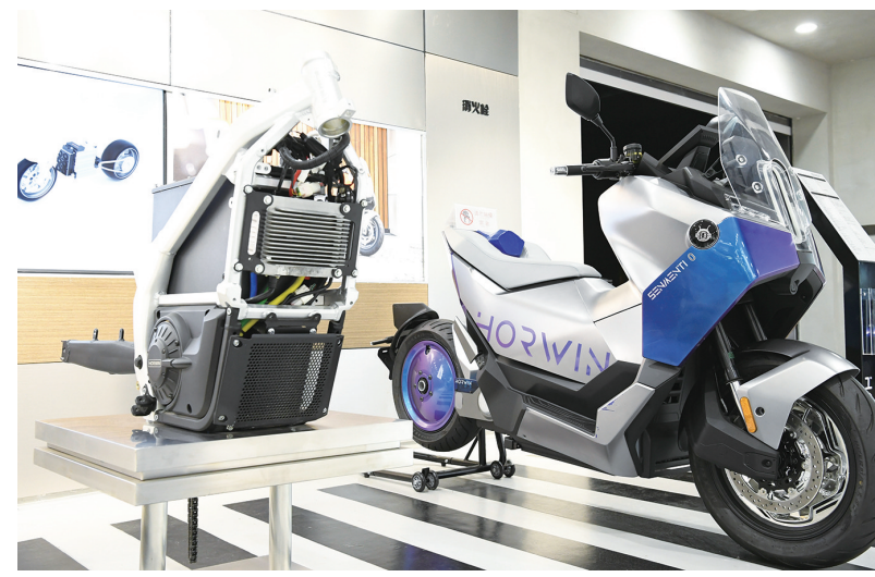
这是6月1日在常州浩万新能源科技有限公司展厅拍摄的Senmenti 0电动摩托车,此车型计划今年量产交付。

近年来,江苏常州着力打造新能源之都,从政策、人才等方面提供支持,助力新能源民营企业“走出去”。浩万新能源科技有限公司初创于2016年,是主打海外市场的智能电动摩托车生产商,目前已拥有200多项核心技术专利。该公司积极开拓欧洲、非洲及“一带一路”共建国家等海外市场,生产的电动摩托车销往100多个国家和地区。