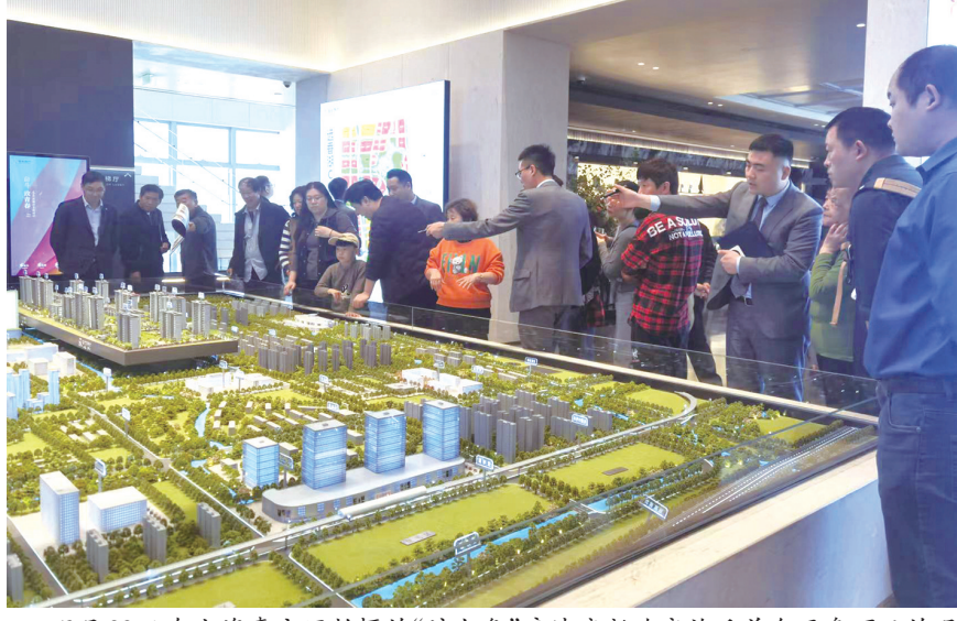
5月28日在上海嘉定区拍摄的“沪九条”房地产新政实施后首个开盘项目的现场(手机照片)。

与此同时,中国人民银行设立3000亿元保障性住房再贷款,支持地方国有企业以合理价格收购已建成未出售商品住房,用作配售型或配租型保障性住房。这是支持构建房地产发展新模式的有效举措,有助于通过市