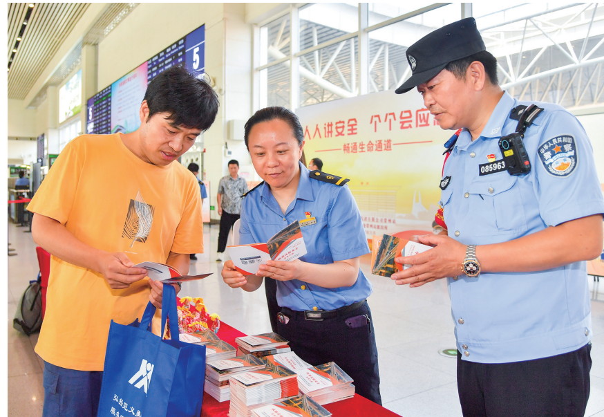
6月18日,铁路常州站开展“铁路安全伴我行”宣传活动,通过组织承诺签名、发放铁路安全手册、讲解铁路安全知识、开展互动问答等方式,向广大旅客宣传铁路安全知识,帮助大家了解铁路运输安全法律法规和铁路出行安全有关知识。

两个月前,姚先生在新北区一运动品牌店与一陌生女士“拼单”,以359元的“优惠价”购买了一双黑色运动鞋,但未能保留购物小票。后来,姚先生发现鞋子遇水褪色,认为有质量问题,要求商家退货退款。他出示了微信转账记录,但因缺少购物小票,商家拒绝提供“三包”服务。多次协商无果后,姚先生抱着试试看的心态来到了新北消协。