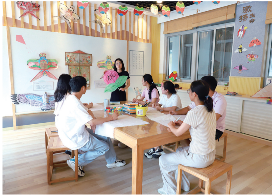
南塘桥小学风筝俱乐部丰富教职工业余生活

为进一步优化教师就医体验,经开区内的基层医疗机构积极引入市二院、市中医院等优质医疗资源,定期邀请名医坐诊,让教师在家门口就能享受到高质量的医疗服务。此外,针对有特殊需求的教职工,还推出了上门治疗、康复护理等家庭医生签约服务,并借助信息化手段简化签约流程,提升服务效率与质量,真正实现了医疗