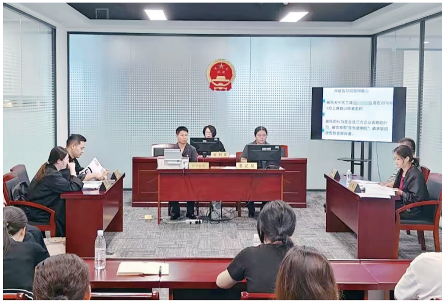
审理知识产权案件,既要保障当事人合法权益,又要让更多经营主体受教获益。

目前,全市法院已联合44家商会及行业协会构建“法院+商会”联动解纷机制,联合市工商联就“法庭+商会”联动解纷机制进行试点,为企业提供更加多元高效的纠纷解决方案