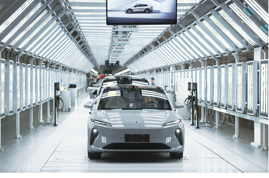
这是安徽省合肥市新桥智能电动汽车产业园蔚来第二工厂内的新能源汽车生产线(5月9日摄)。

重庆一位车主日常驾驶一辆售价近30万元的新能源SUV,近期在4S店更换一个尾灯花费1.8万元。另一位车主开一辆同样价位的增程式SUV,在4S店更换机油机滤,也花费1300多元——该保养项目在连锁汽修店报价仅600多元。“车辆质保期内,如不在厂家4S店进行维修及保养,则将‘脱保’。所以我只能接受这一高价。”该车主说。 业内人士指出,新能源汽车修车贵,一方面与市场上新能源汽车保有量占比仍较小、市场流通配件较少有