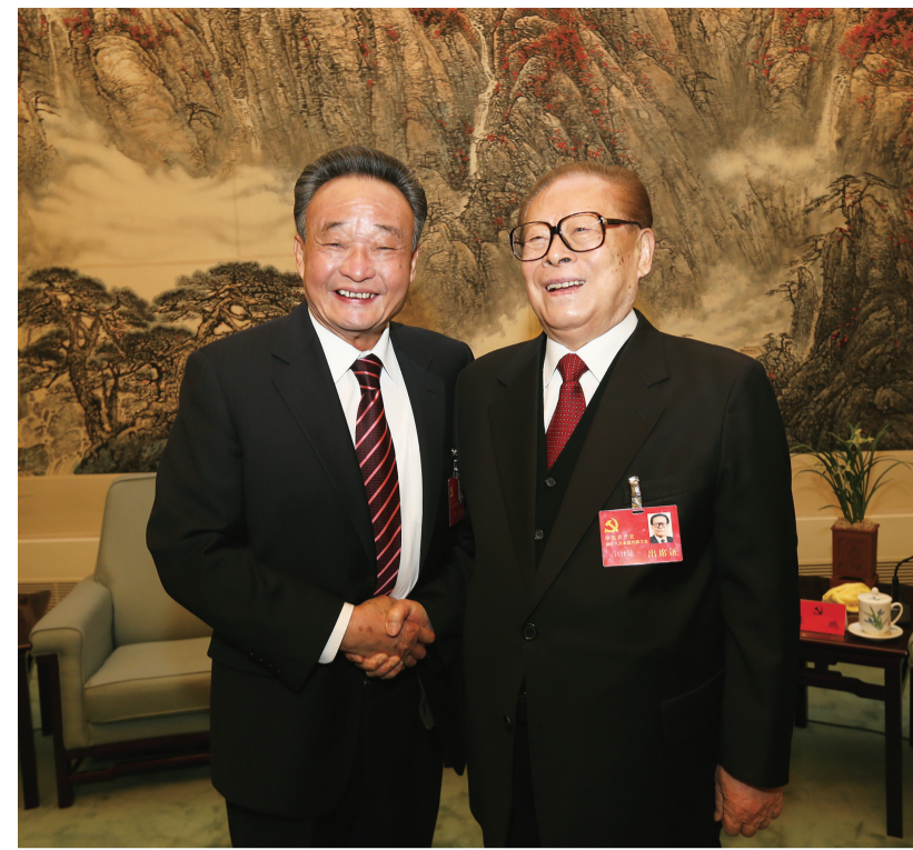
2012年11月14日,中国共产党第十八次全国代表大会在北京闭幕。这是闭幕会前,江泽民同志与吴邦国同志在一起。