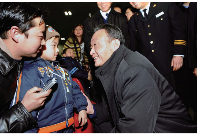
2008年2月3日,吴邦国同志在北京西站候车室与旅客交谈。