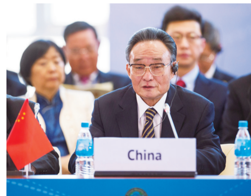
▲2013年1月28日,吴邦国同志在俄罗斯符拉迪沃斯托克出席亚太会议论坛第21届年会,并作题为《坚持和平发展促进合作共赢》的主旨发言。