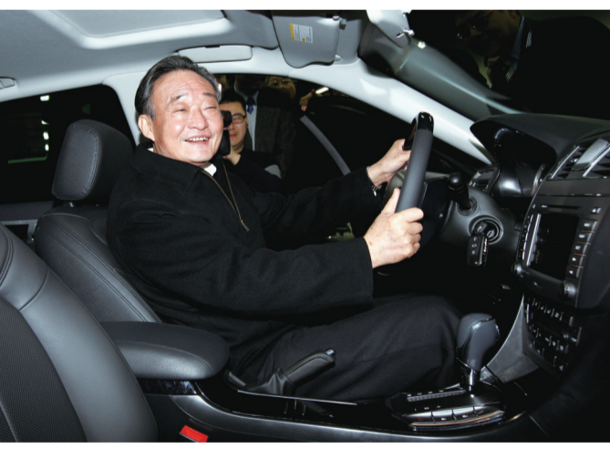
2010年1月30日,吴邦国同志在上海汽车集团股份有限公司技术中心察看新能源车。