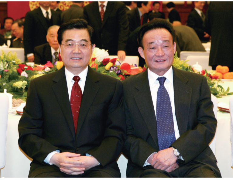
二〇〇五年一月一日,全国政协在北京举行新年茶话会。这是胡锦涛同志与吴邦国同志在一起。