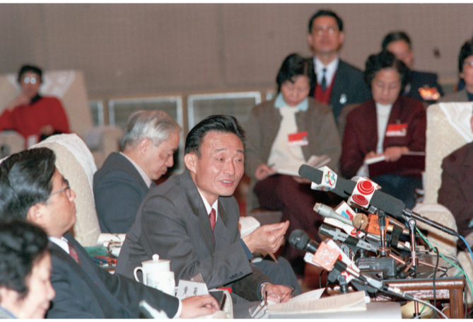
1994年3月,时任上海市委书记的吴邦国同志在全国两会上海代表团全团会议上。