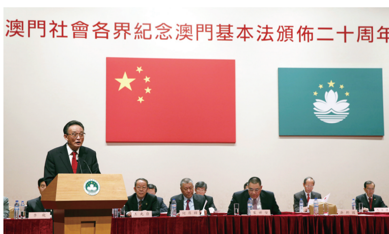
▲2013年2月21日,吴邦国同志在澳门文化中心出席澳门社会各界纪念澳门基本法颁布20周年启动大会并发表讲话。