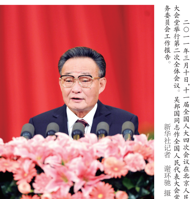
二〇一一年三月十日,十一届全国人大四次会议在北京人民大会堂举行第二次全体会议。吴邦国同志作全国人民代表大会常务委员工作报告。