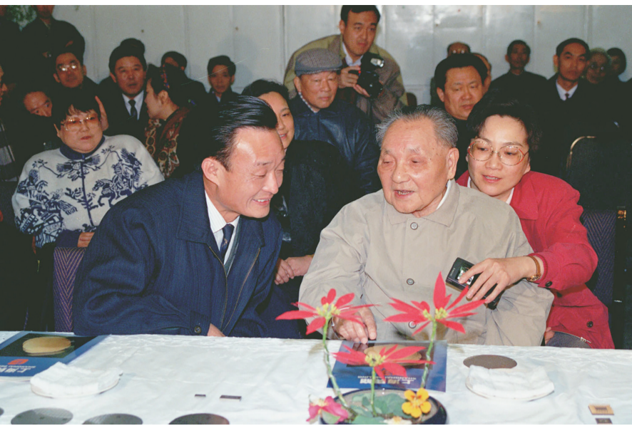
▲1992年2月10日,邓小平同志在上海贝岭微电子制造有限公司参观时与吴邦国同志交谈。