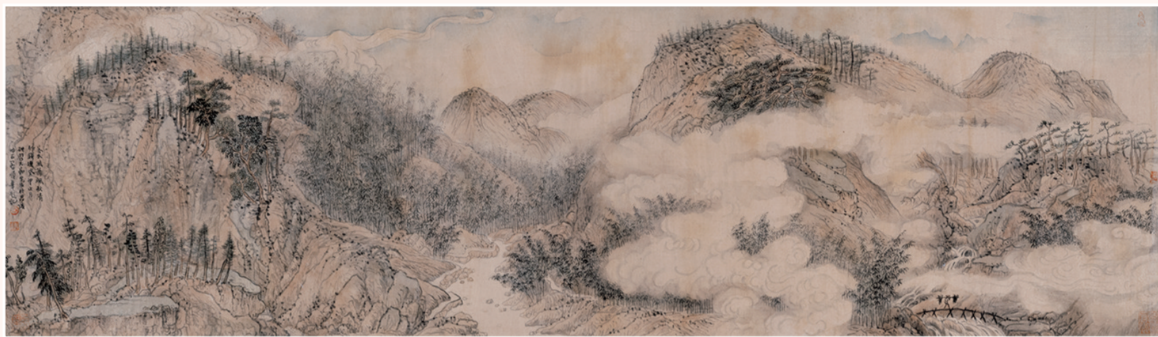
竹林氤氲图 绢本设色 纵30厘米 横106厘米 2023年