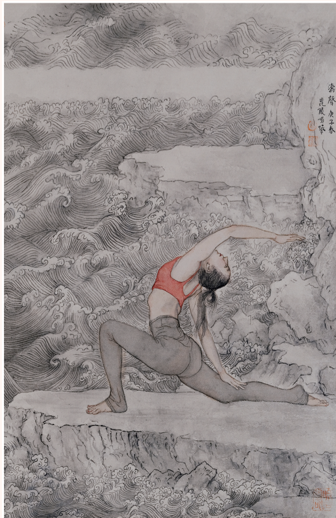
涛声 绢本设色 纵41厘米 横29厘米 2020年