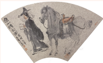
进山读书图 纸本设色 纵22厘米 横40厘米 2018年