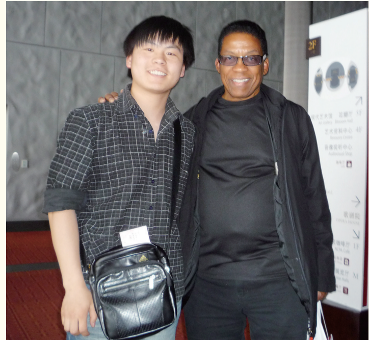
2010年5月10日,笔者与Herbie Hancock合影。