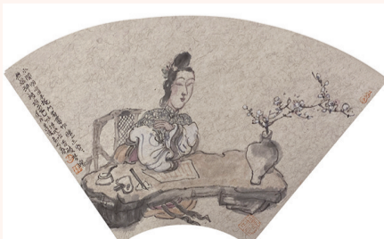
小阁明窗半掩门 看书作睡昏昏 纸本设色 纵22厘米 横40厘米 2018年