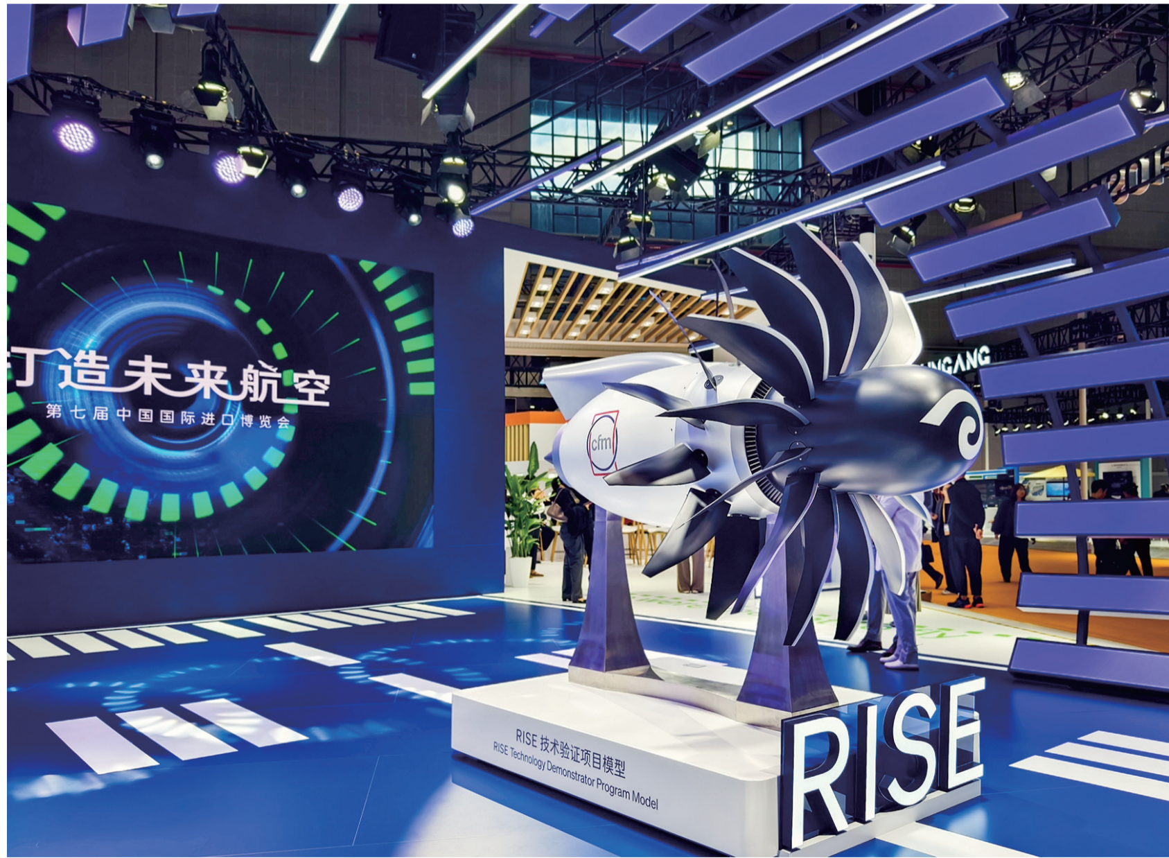
(RISE)模型,诠释了在可持续未来航空领域的卓越技术成果