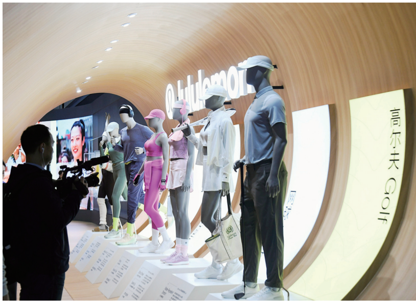
国内外一线品牌商参展进博会