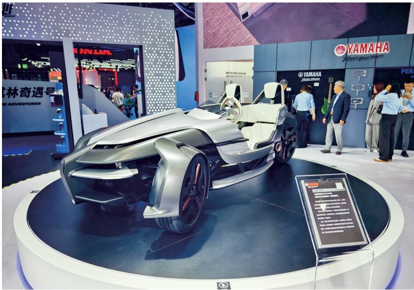
在中国首展的电动三轮概念车