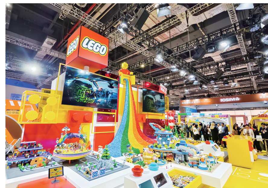
乐高主题装置“释放玩乐超能力”