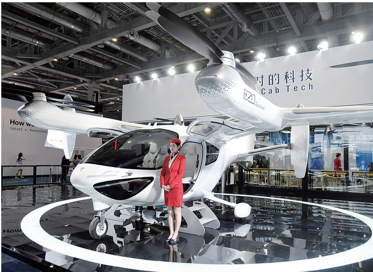
进博会低空经济展区

11月5日至10日,第七届中国国际进口博览会在上海国家会展中心如期举行。这朵璀璨的“四叶草”再次成为全球瞩目的焦点,各国宾客纷至沓来,共赴这场开放共享的盛会。