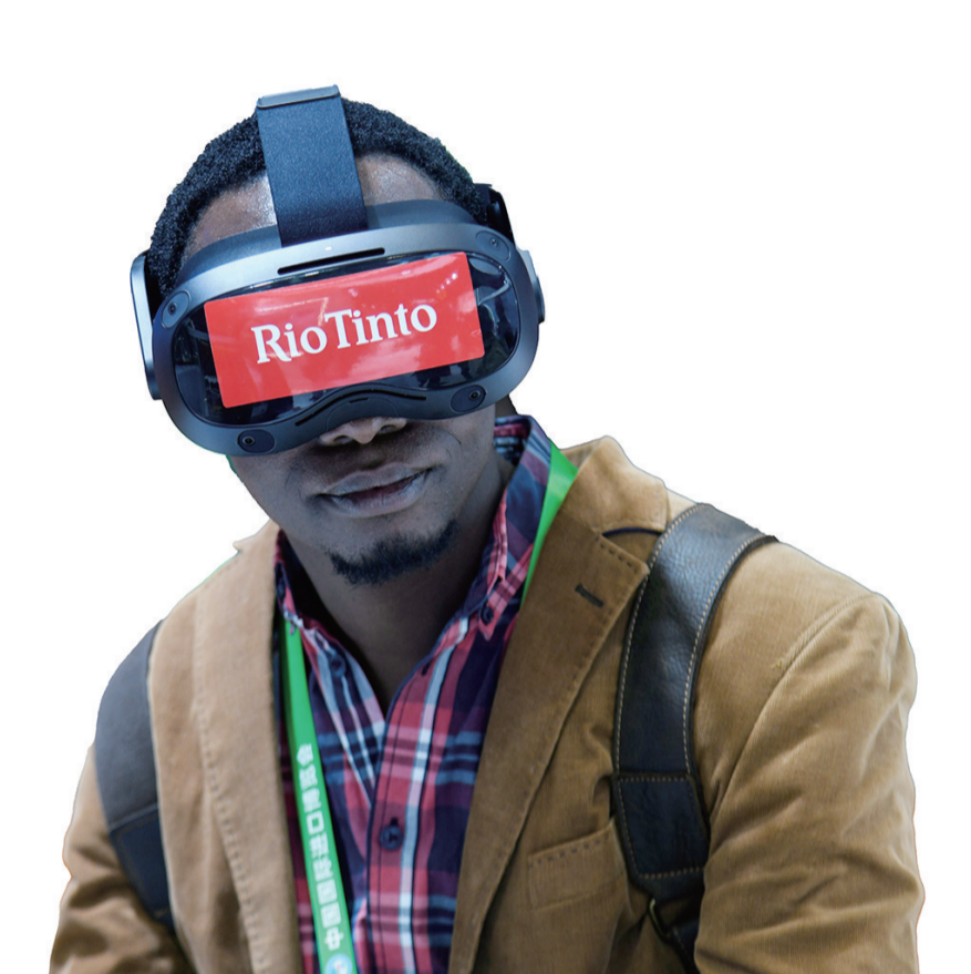
国外客商代表参观进博会展馆

进博会的“溢出效应”持续释放,不少“展品”变“商品”,从“四叶草”走进中国大市场。“四叶草”再度进入进博时间,不仅为全球企业提供了展示交流的平台,也为中国推动高水平对外开放、与世界共享发展机遇写下了生动的注脚。相信在未来,“四叶草”将继续绽放光彩,为全球经济合作与发展注入新的动力。