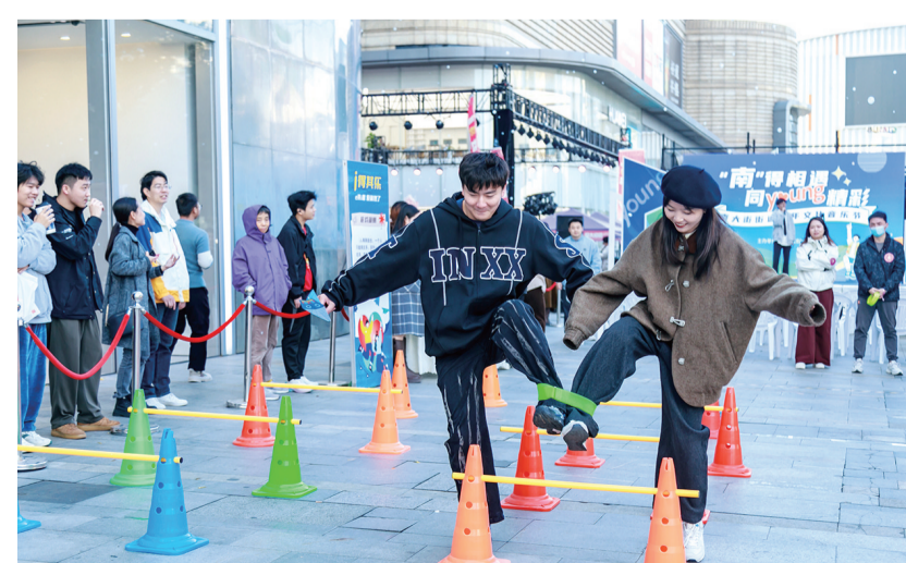
11月23日下午,南大街街道在常州钟楼吾悦广场开展了一场别开生面的MBTI青年交友联谊活动。辖区30余名单身青年共同奔赴一场新颖有趣的都市青年派对。仪式上,团区委和钟楼吾悦广场相关负责人共同为“小楠有Young”青年交友阵地揭牌。 朱丽雅 王咏春 图文报道

界,地理位置优越,交通便利。总建筑面积4.34万平方米,可提供人才住房700多套。同时配备种类丰富的功能区,包括影音室、健身房、电竞区、手游区、露天花园、会议室、路演大厅等。钟寓国际人才社区通过一系列的社区活动,成功为青年人才的日常生活增添了丰富多彩的元素。人才社区还与钟楼区团委合作“青年夜校”,让青年们的夜生活更加充实。