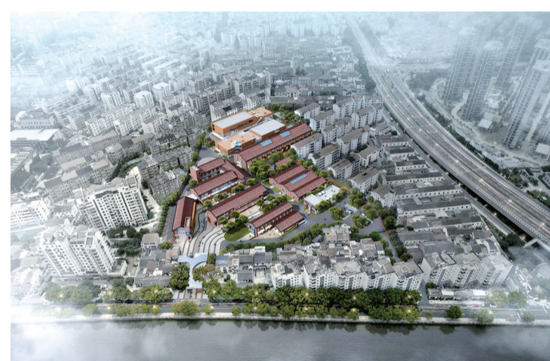
常州航仪厂改造提升项目(运河五号二期)效果图