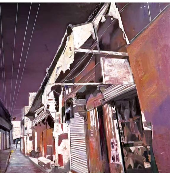
时光老宅(油画) 殷丽华