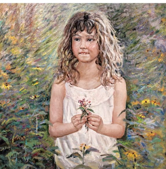
为罗德岛的小朋友照相(油画) 周世明