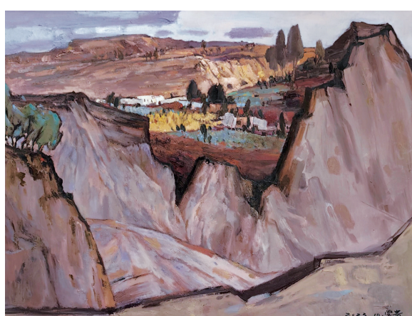
陕北之秋二(油画) 陈学贵