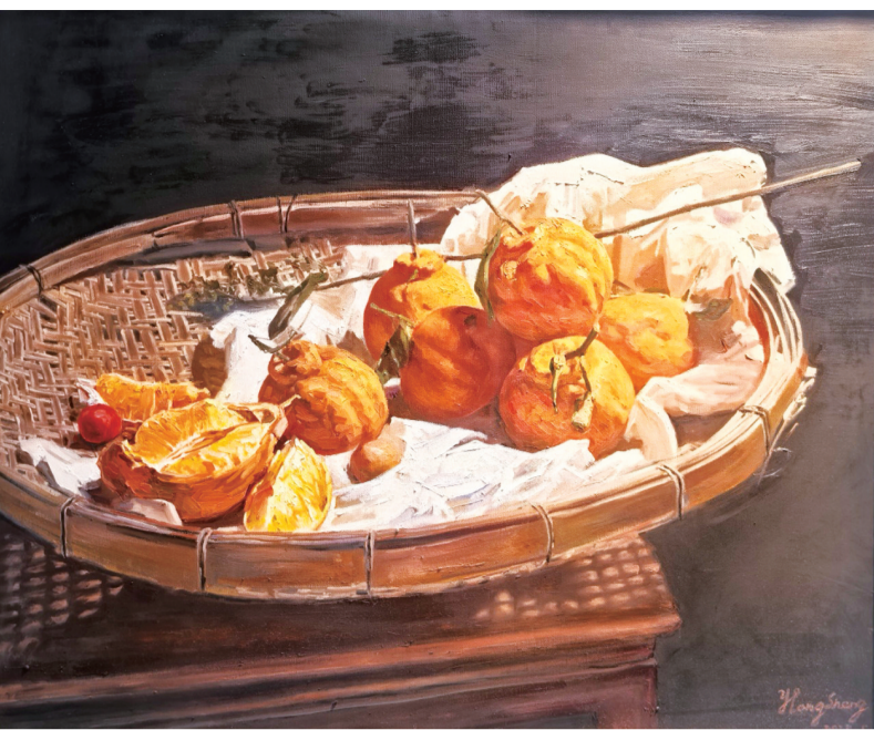
丑橘之美(油画) 陆洪生