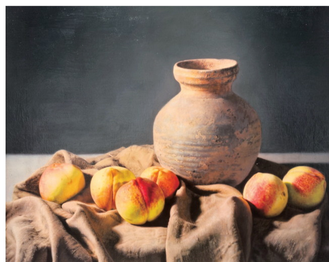
水蜜桃与陶罐(油画) 朱双双

刘海粟美术馆(常州美术馆)中华恐龙园分馆位于迪诺水镇5号楼二楼,面积近一千平方米。“探微求真——常州市第四届油画双年展”将延续到2025年春节,节假日照常开馆,欢迎广大市民朋友前往参观交流分享。