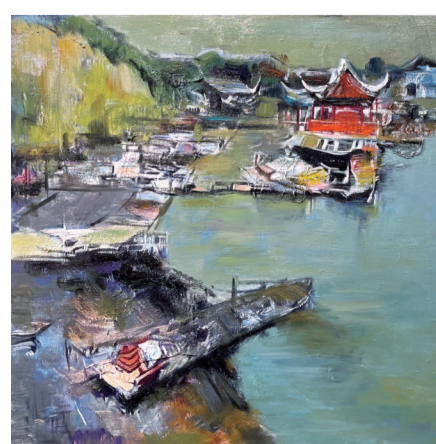
大运河畔古刹风情(油画) 沈成九