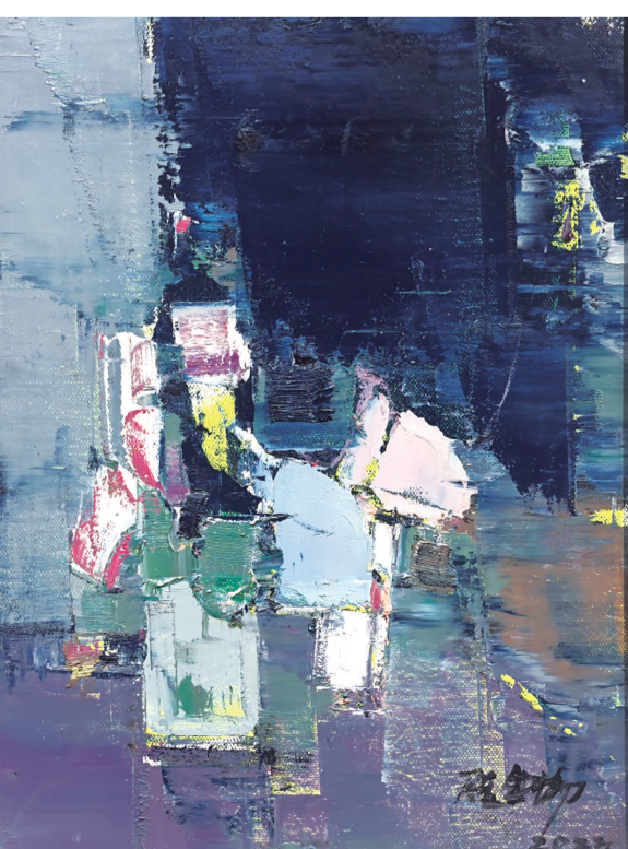
蓝色空间(油画) 陈金柳