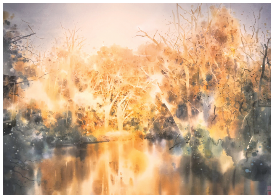
静静的黄昏(水彩) 李庆