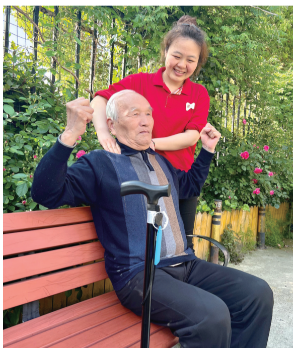
养老机构内,工作人员在为老人按摩。