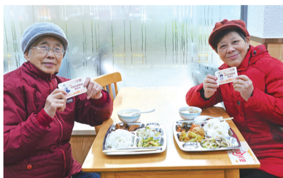
老人在助餐点愉快地就餐。