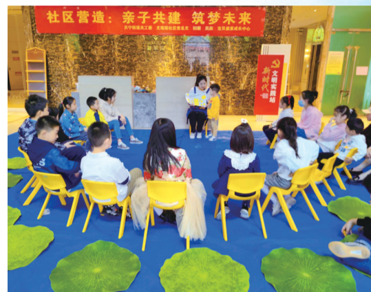
社会组织在举办亲子活动。

关心残疾人,是社会文明进步的重要标志。我市不断提升残疾人服务水平,为残疾人幸福“加码”。开展“精康融合”行动,新建8家“德康驿站”,精神障碍社区康复服务覆盖74%的镇(街道),服务9541名精神障碍患者。康复辅助器具社区租赁服务开通线上渠道,为符合条件的困难群众提供租赁补贴,实现与长护险、残疾人辅具适配等政策衔接互补。