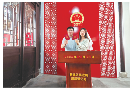
新人在新设的新北区牡丹园婚姻登记点领证结婚。