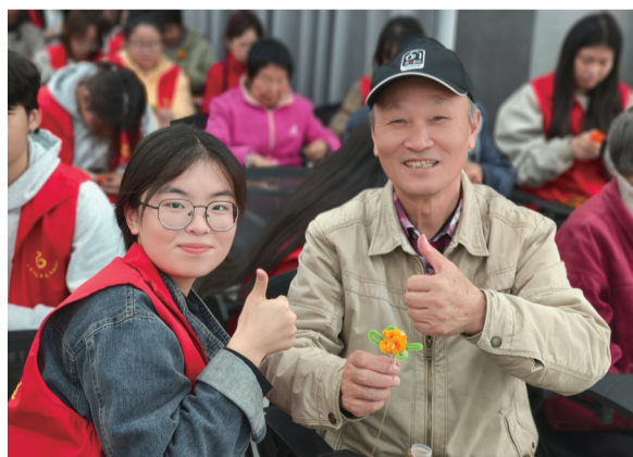
社会组织举办“守护银发”大学生职业启航训练营项目,大学生与老人一起制作胸针。