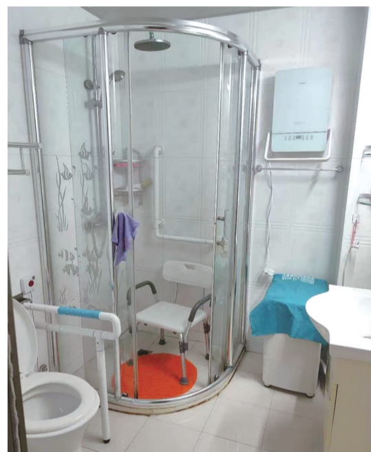
适老化改造后的卫生间。