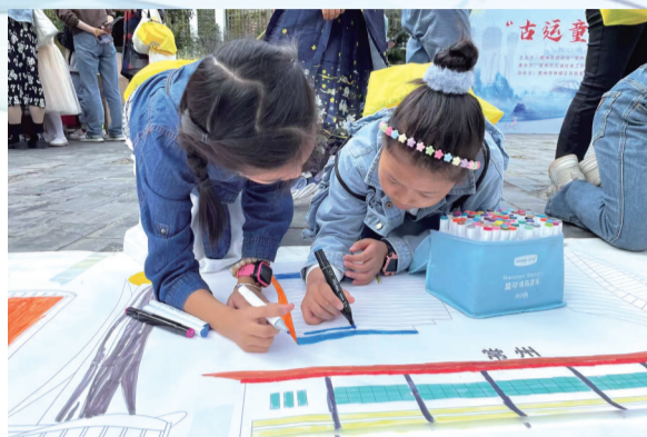
市救助管理站组织秋季课程之寻根之旅活动。