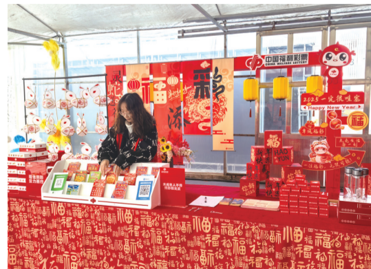
常州武进福彩开展春节地推活动。