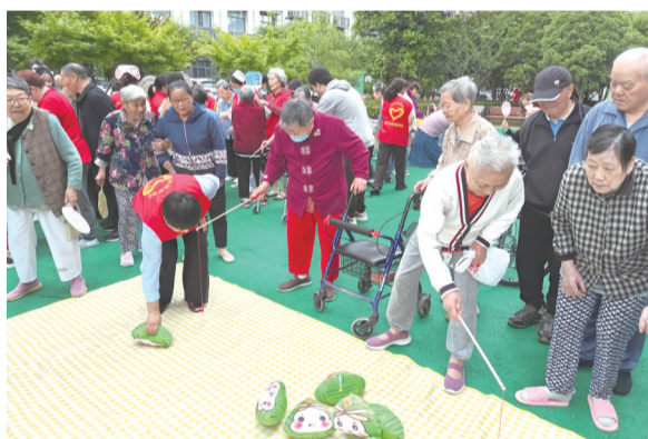
市福利院为老人举办丰富多彩的活动。