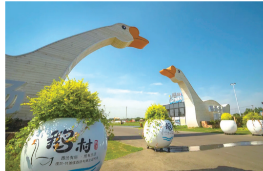
民政部门开展村级特色地名保护活动,一批特色村级地名被设立了标志牌。