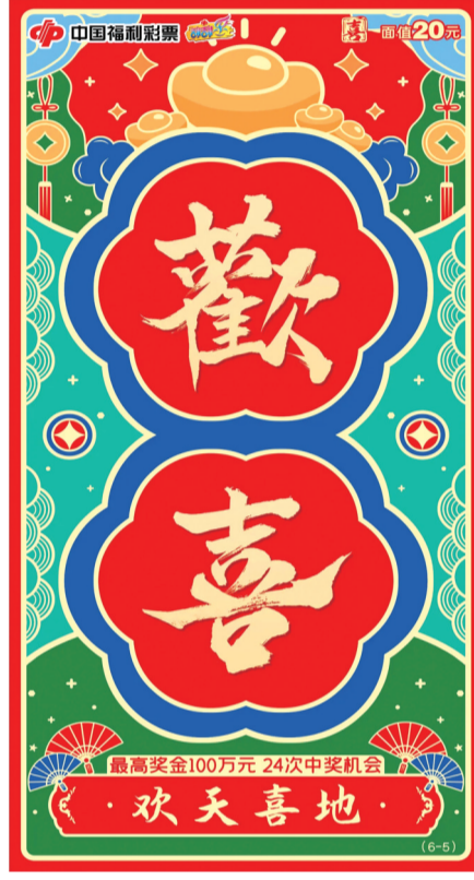
刮刮乐“喜”部分票面